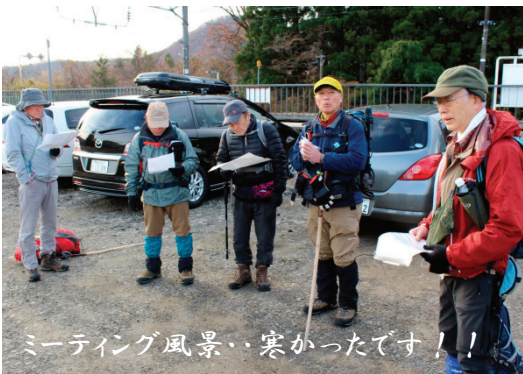
ミーティング風景・寒かったです！！