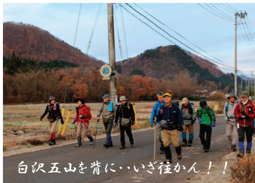
白沢五山を背に…いざ往かん！！