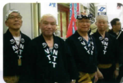
青葉祭りの木遣り参加メンバー

会員の健康増進、親睦融和を第一としており、希望者へは稽古終了後「氣」による健康法・呼吸法等をご指導します。詩吟の他、木遣りも練習しております。練習日に体験してください。