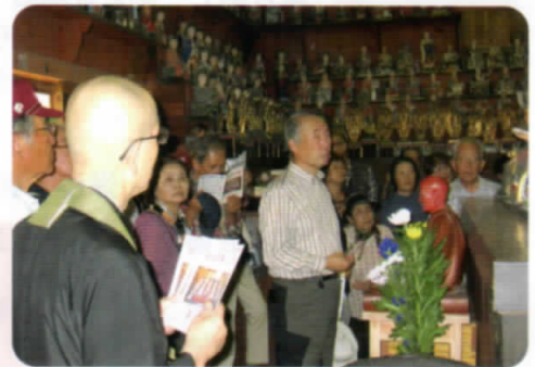
稲荷山玉龍院(高島町)の五百羅漢堂にて

仙台市内を中心に「城館跡・神社・仏閣」などを、当会の担当ガイドが案内します。例会は大人の「遠足感覚」で史跡を訪ねます。年1回はバスをチャーターし、日帰りの行程で遠隔地まで足を伸ばします。みなさん、例会に参加して歴史探訪してみませんか。また、女性も例会を体験し歴女に変身しませんか。7名の女性会員がいます。