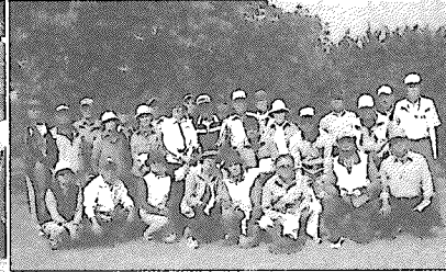
グラウンドゴルフ愛好会メンバー

入所中の皆様からは、大層な感謝の言葉を頂きました。会員たちは、これまでの苦労が報われそして、今年目標が達成されたことに感激していました。