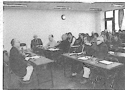
歴史に想いを馳せました

5代藩主信興は17〜41歳まで25年間在位し10人の側室がおり、12男12女の子供が生まれ、また8代藩主信真は19〜64歳まで47年間在位し4人の側室がおり、11男9女の子供が生まれている。この時代生まれる子供も多かったが早世する子供も多かった。