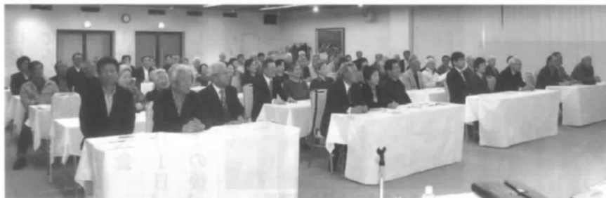
電友会村山クラブ平成30年度(第39回)定期総会模様