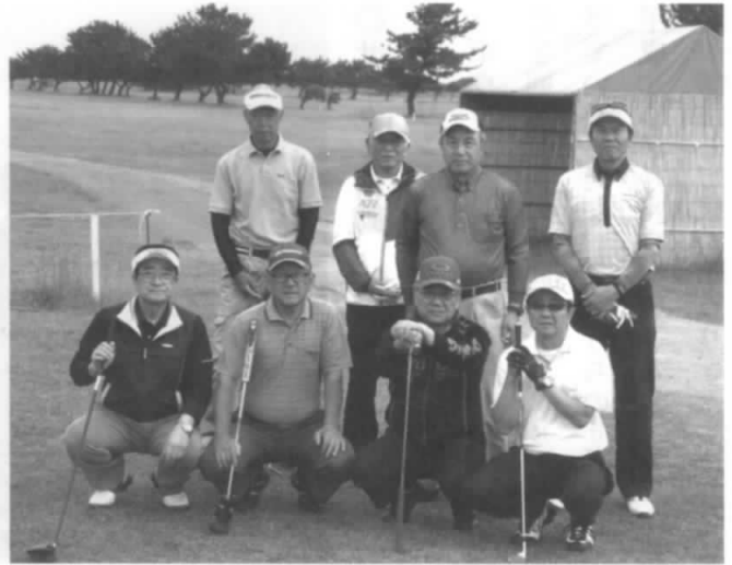
コンペスタートの参加者

議事に入り、平成29年度事業報告及び決算報告ならびに会計監査報告がされ、更に平成