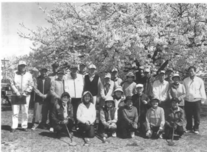
普段の実力で和気あいあい・・・ だよ

本年度から、大会競技における入賞機会の公平を期するため、男性、女性別の表彰とし、会員全員が優勝を目指せるようにハンディキャップ規定を大幅に改定しました。