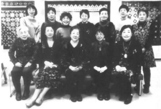
淑女の集まり・・・ちょっとすまし顔