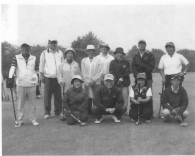
グラウンドゴルフ愛好会メンバー

・月1回の例会ではグラウンドゴルフのレベルアップは勿論ですが、会員同士の親睦を図っています。新会員はあるものの健康上の理由から退会者もあり会員数はほとんど変わっていません。当面の課題は会員を増やすことでもあります。