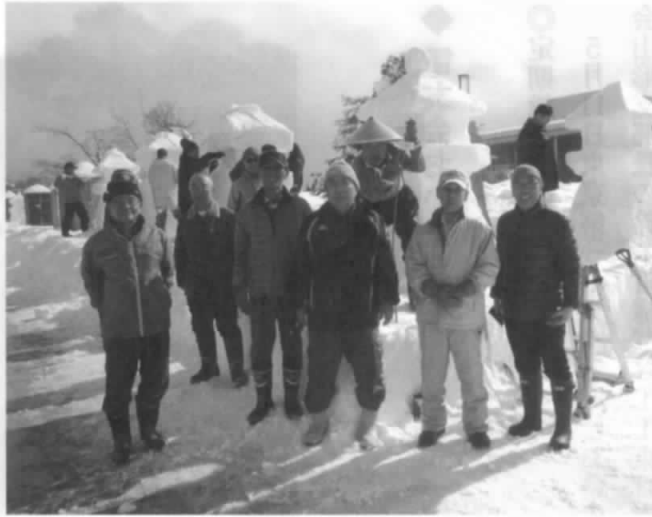
寒さにも負けず 笑顔で参加

「市民参加」、「おもてなし」の3つで、平和を願う鎮魂碑が制作され、市民参加でふるさとを愛する心を醸成し、「おしよしな」の心を以って産業振興を図ることを目指しております。この祭りに少しでも協力していくことは大変意義あることと思っております。