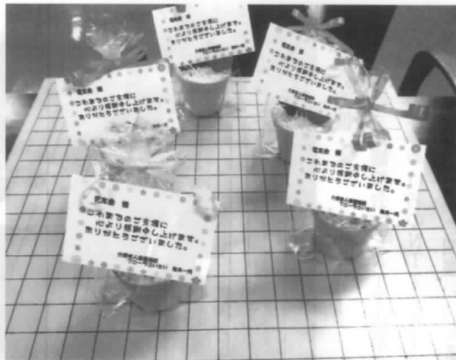
いただきました記念品・・・ 感謝です