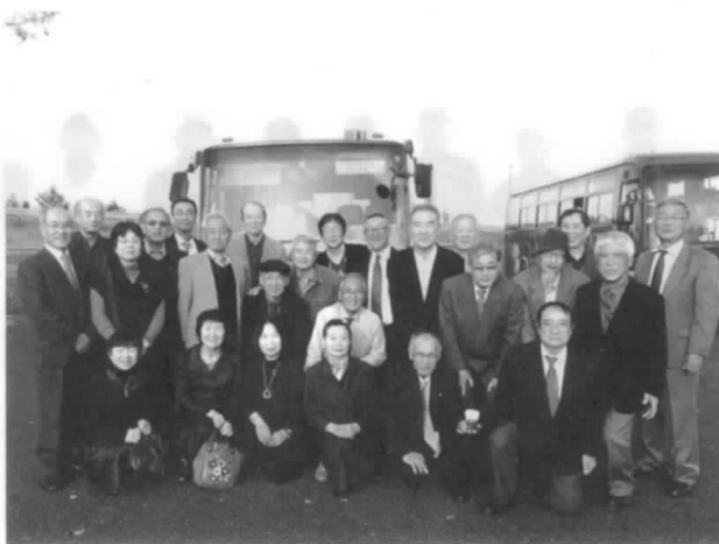
みんなニコリ! 帰路途中のパーキングで!

28年まで庄内地区(酒田・鶴岡)で実施されていたNTT山形支店との「OB・OG交流会」が、29年から県内一本化して11月9日山形市のメトロポリタンで行われた。