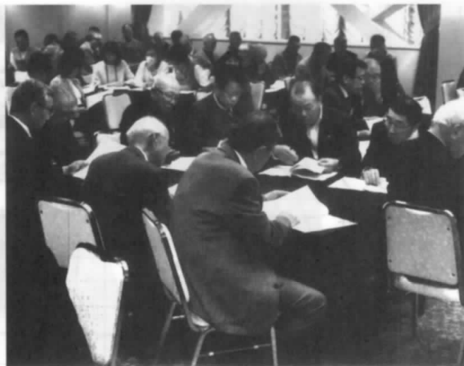
熱心に議案書を見ていますヨ