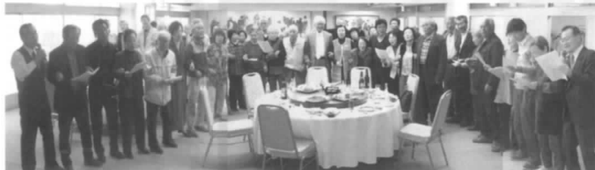
「老いも若きも輪になって」スクラム組んで、天にも届けと大合唱!