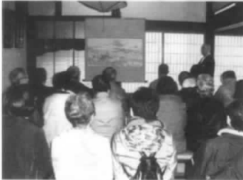
蚶満寺での和尚さんの講話

道の駅「ねむの丘」4階から「九十九島」「八十八湯」の景観を楽しむことができ、お土産をいっぱい買って帰りました。