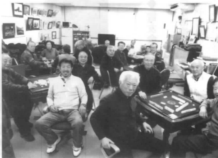
6卓24名 私がトップ雀士です

サークル発足以来5年を経過しても、雀キチ達は和気あいあい、歳を忘れ、脳の活性化に益々拍車を駆けております。