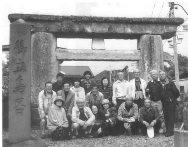
「元木の石鳥居」現存する日本最古の一つで、平安前期の建立、最上三鳥居の一つと言われる

①特別企画「山形の山岳信仰とその歴史を訪ねる」及び「保険と共済の比較勉強会」の2点 ②1泊旅行は「白神山地と鱒ヶ沢温泉の旅」 ③GG、PG、PC教室、ゴルフ等は例年通り実施する。 総会後の懇親会では、