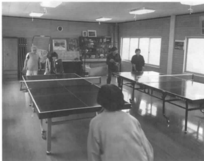
お借りしている 卓球場