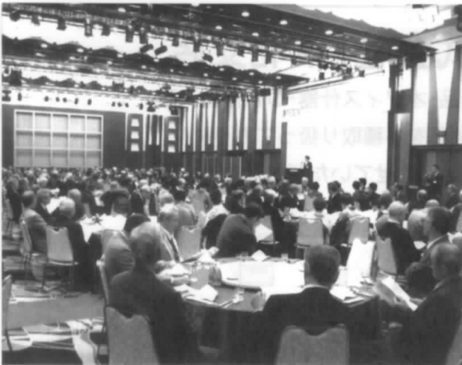
初めて各地区が一同に参集しました… 溢れる熱気！！

第15回「NTTとOB・OG交流会」が11月13日にホテルメトロポリタンで開催されました。今回が初めて全県のOB・OGが一堂