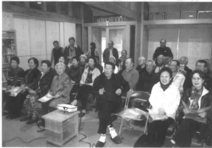
震災復興の現況を 伺っております

目、この耳で感じたことは大震災で失われたものが数多くあり、多くを失って学んだこと、大切だと気付いたことがたくさんあると思います。自然災害の脅威、命の大切さ、家族との繋がりと色々な事が胸中を去来しました。2日目は遠野でライブの語り部を聞き、全員無事に帰りの途に着きました。