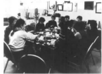
さ～勉強の後のお茶です。こっちが目的かな？

OBサロンで1人1人の作品を参考に勉強しあい、お茶のひと時で楽しく元気を分かち合える仲間として、又9月の霞