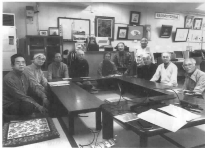
好評会 批評会 なごみ会かな

4回霞城クラブ芸術作品展」へ1人2点以上の出品に向けて、月例会や撮影会等を実施しながらレベルアップに努めているところです。