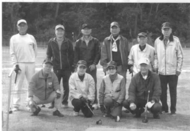
勢揃いした第6回大会参加者、大森山公園P G場