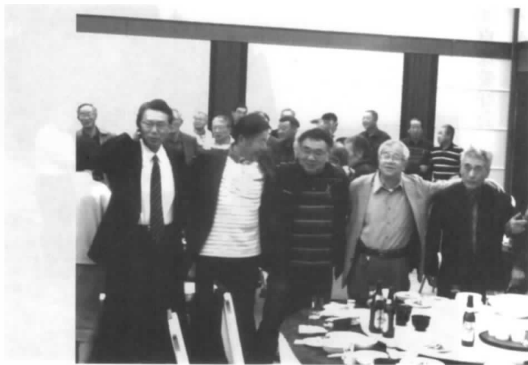
総勢68名が 楽しい時間を過ごしました

が、山形もとつくに葉桜の観桜会となりましたが会場は話に花が咲きました。秋の芋煮会にまた元気で会うことを約束して終宴となりました。