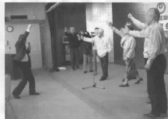
盛り上がったジャンケン大会

①特別企画「山形の山岳信仰とその歴史を訪ねる」及び「保険と共済の比較勉強会」の2点 ②1泊旅行は「白神山地と鱒ヶ沢温泉の旅」 ③GG、PG、PC教室、ゴルフ等は例年通り実施する。 総会後の懇親会では、