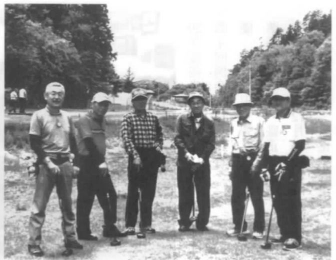
練習は上出来、 本番は緊張ですヨ

全員参加とはいきませんでした。和気あいあいにコミュニケーションを深めながら上位入賞を目指すべく技術の研鑽に努めました。