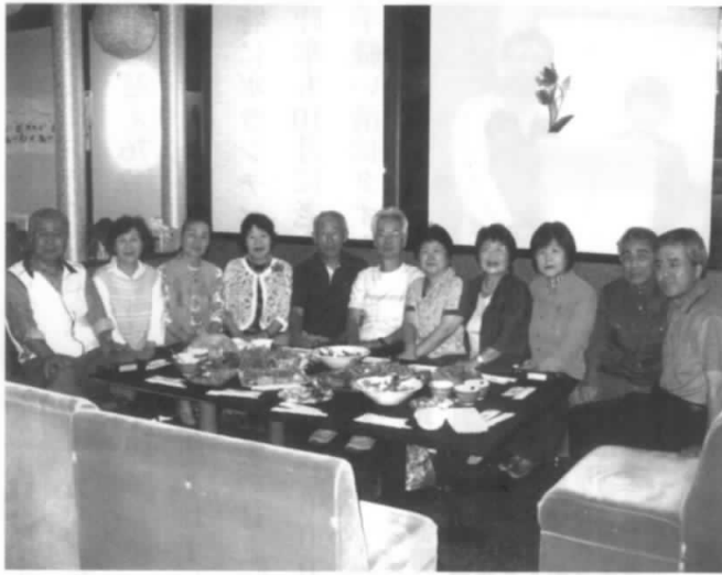
カラオケ愛好会 メンバー

・寒河江地区で最も会員数の多い愛好会です。7月と12月には親睦を兼ねた「例会&ピヤガーデン総会」を行い飲みながらの会話も楽しんでおります。