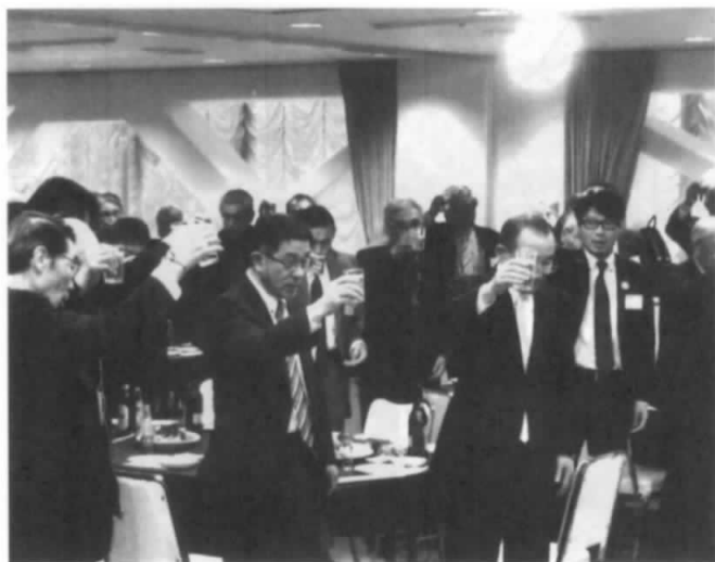
乾杯・・・桜もいけどビールで一献