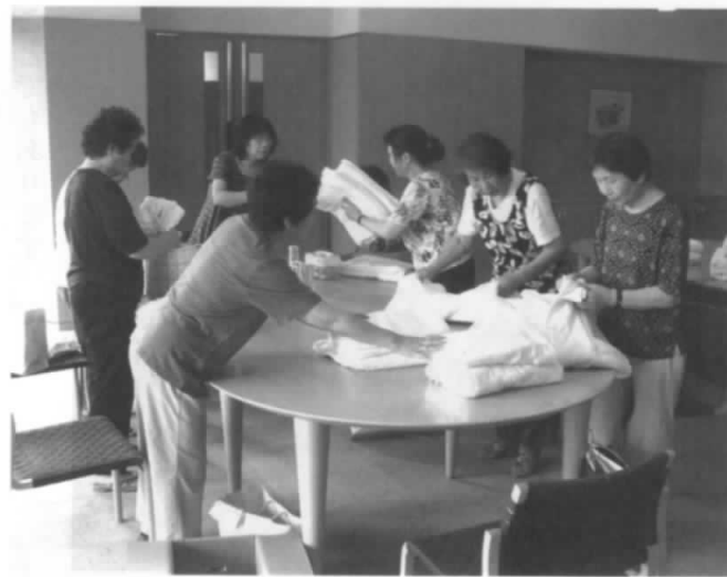
ボランティアグループ「愛のはと」 活動模様

なりました。これまでいろんな賞も頂き有り難く思っております。年々歳を重ねますが、若い方には未永く続けていただくようお願いいたします。