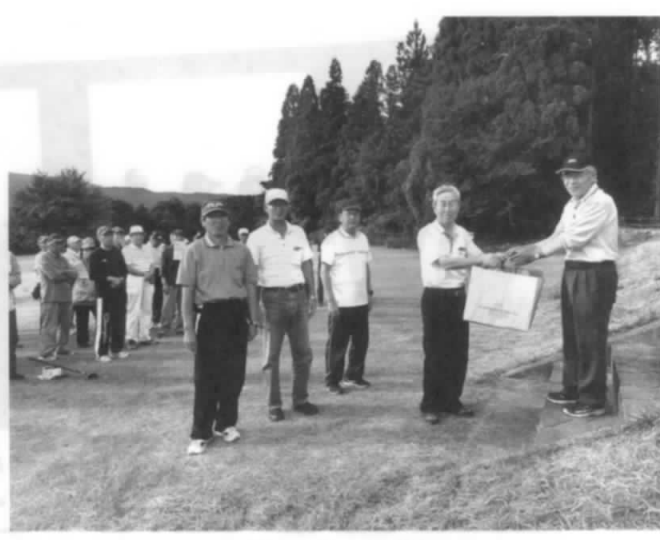
パークゴルフ愛好会メンバー

・会発足から6年目となりました。月1回の例会に向け、其々が自主トレを積み重ね腕を磨いております。