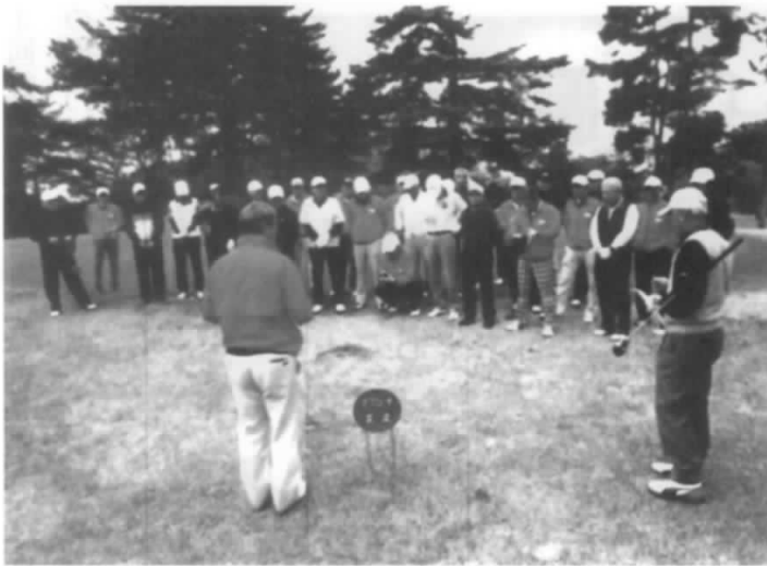
新会長 仲良くフェアプレーと訓示・・・ですネ