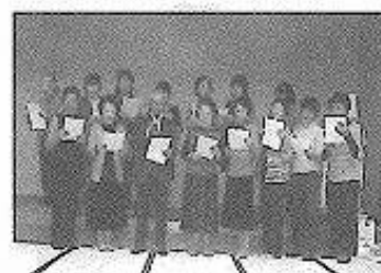
懇親会でのコーラス

議事に入り、事務局からの議案書の説明に対して若干の質疑がありました。総会後の休憩時には、入浴する人、賑やかに歓談して旧交を温める人等有意義な時間を過ごし懇親会に移りました。懇親会では、「アネモネの会」のコーラス