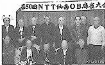
第50回大会懇親会模様