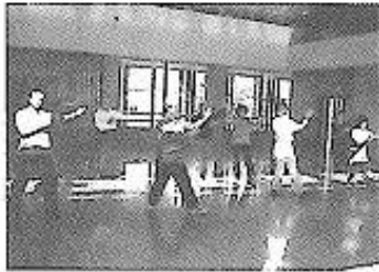
25年11月8日太極拳講習会