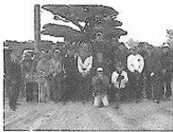
総会後の定期練習で、記念撮影

予定し、恒例の3局交流大会は古川パークゴルフ愛好会主催で加美町の「ふれあいの森パークゴルフ場」で行われる予定です。