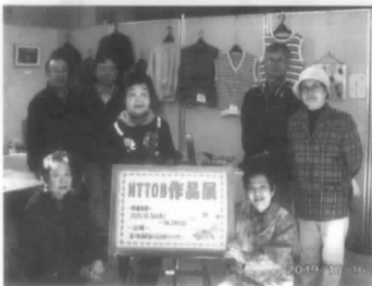
飾り付けの日は男性も協力しますよ