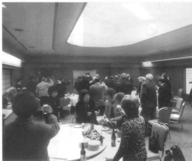
講演会後の懇親会 南部藩の歴史で盛り上がりました

ルートを変更するなど艱難辛苦を経て、現在の盛岡城と町割りが出来上がったと伝えられています。盛岡城は、敵からの攻撃に備え①城内②内丸③曲輪に区分し、町人も曲輪の内に住まわせました。町割りは「五」の字を基本に敵が攻めて来ても方向が分かりにくくなるよう道路作りをしたとのことで、現在の市