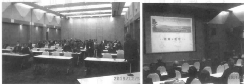
盛岡の歴史等内容の濃い講演に続編あり、かも。

盛岡の町割りは、南部家第27代藩主南部利直が1598年に政治の中心を三戸から盛岡に移し「盛岡城」を築城したのが始まりと言われ、その後第28代藩主重直までの約75年間度々氾濫する北上川の