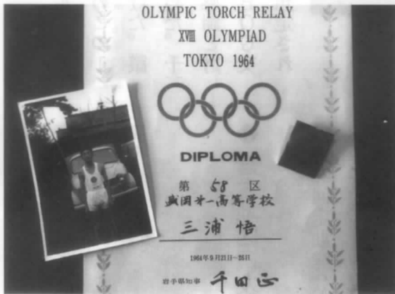
オリンピック旗をもって、聖火ランナーの併走した証明書とメダルなど

高校1年のこの年、陸上競技部の先輩が掲げるトーチにオリンピック旗を持って伴走したのを思い出します。