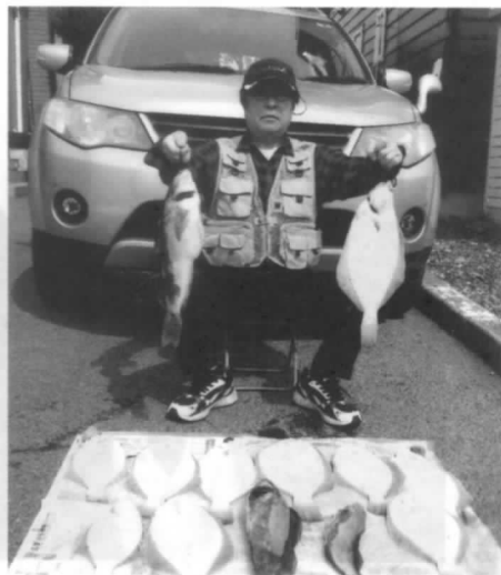
いつものことながら大漁です

ぎ温泉「愛真館」において12名が参加し、1泊での忘年会を開催し、ゲーム等で盛り上がり、楽しいひと時を過ごしました。