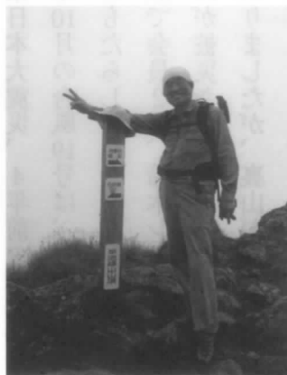
早池峰山 山頂 (R1.7 岩手県)