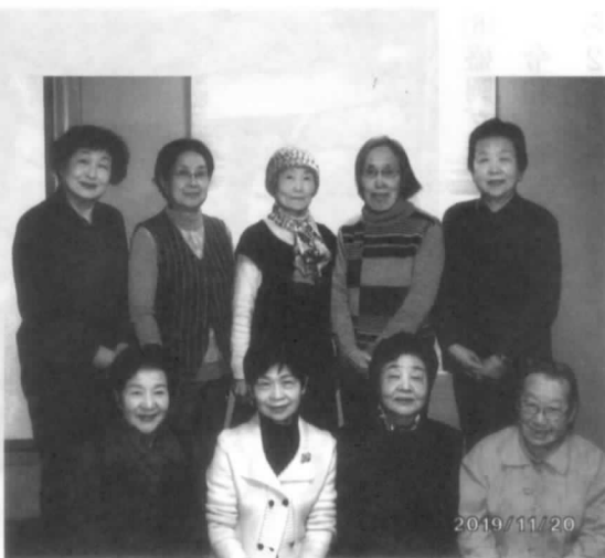
反省会 おつかれ様でした

でも皆年を重ねてきて20周年を節目として風の丘の展示会は終了としました。今迄の継続に本当に会員の皆さんありがとうございました。お疲れ様でした。