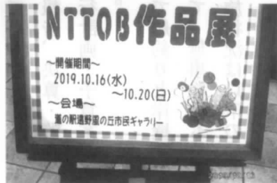
二十周年目の作品展示会

少しではあるけどその収益金等は遠野市の社会福祉協議会に、毎年歳末にはお気持ちの寄付も欠かした事はありません。そしてサロンで活動の経費にしたり、旅行をしたり、本当に皆さん心をひとつにし退職しても和気あ