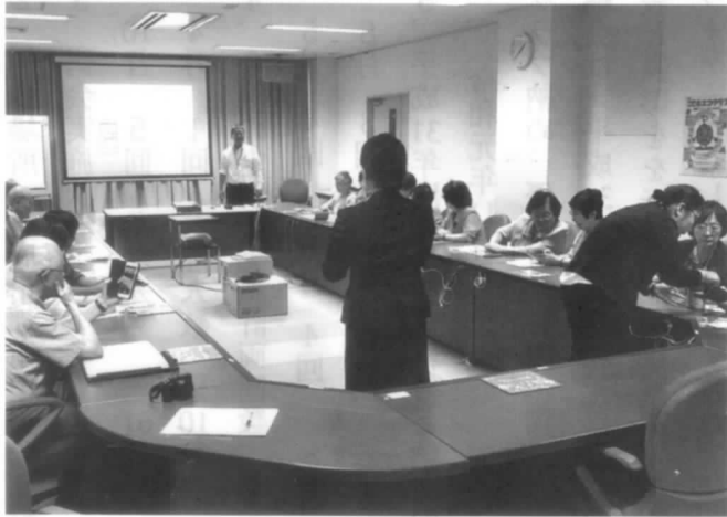
スマートホーム教室の様相