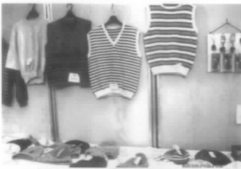
展示物の一部 まだまだいろんなものがあります

最初の頃は15日間、そしてだんだんに10日間、そして展示者が多くなり1団体1週間となり、そして昨年は私達は5日間となりました。日々2名ずつの当番で場所を守り接客しながら手造りのものを販売してきました。