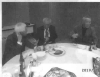
今日は有意義だった...

内の「五」となる道路を写真で紹介されました。市内の橋の整備や欄干の擬宝珠の由来、旧町名の役割など盛岡市民にとって興味深い話で時間がたつのも忘れるほどでした。参加者から続編を考えてほしいとの要望があり、大好評のうちに終了しました。