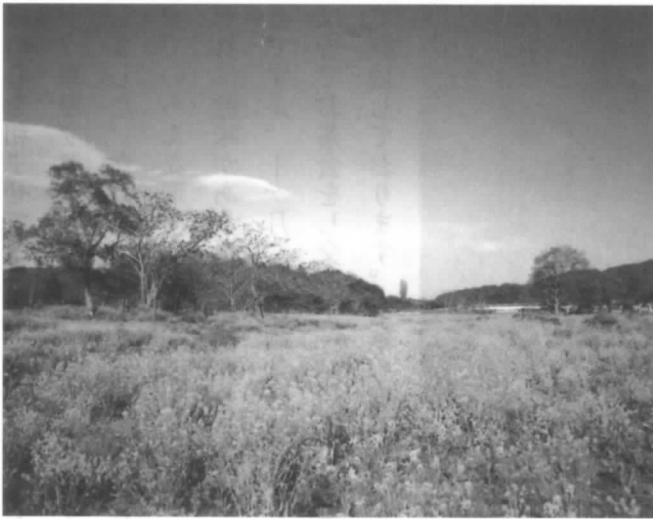
かつてのグランドが菜の花でいっぱい

3・11の震災以降GG会場のあった河川敷公園は流され、「滔々と流れる閉伊川」は今度は昨年の8月30日の台風10号で壊滅状態の被害となった。