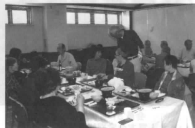
いっぱい食べてけらいネ!

さて、懇親交流会も盛り上がって、気がついたら珍しくカラオケのない空桶で楽しく散会しておりました。