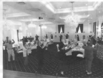
みんなで「さくら音頭」

◎総会開催 29年度総会を、5月10日まるしちザ・プレイスで、多数の参加を得て開催しました。議案は全て承認されました。 今年はい日帰り旅行の年です。場所と時期が決まっています。連絡致しますので多数参加しましょう。 懇親会は「さんさ時雨」の踊りで幕をあげ歌に踊りにと皆さんに活躍して頂き、最後に