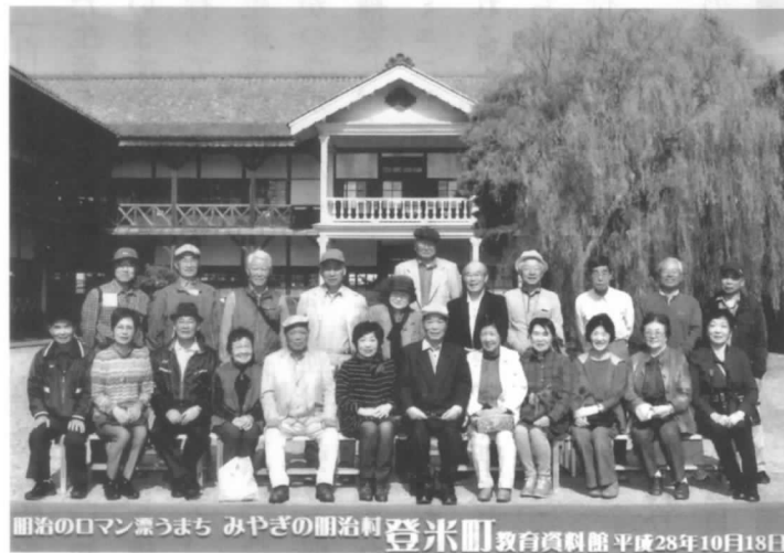
毎年恒例の1泊レク

津虚空蔵尊へと向かった。ここでは任職からの虚空蔵尊についての丁寧な説明がありましたがカメラ虫の成群に悩まされて、よく話が聞き取れなかった。 そして、宿泊地泊り崎荘に到着、夜の宴会まで、たっぷり時間があるため太平洋を一望に眺めながら散策を始める方々もいて、ゆっくり休憩ができたことは好評だった。 いよいよ夜の宴会の始まり、贅沢お膳の献立は海鮮料理、酒もビールもうまい、従業員と女将による踊りと歌のシヨウを皮切りにカラオケを満喫した。