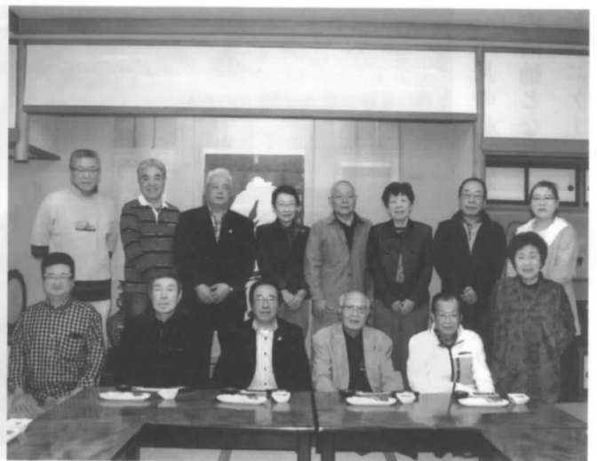
不来方釣りクラブの皆さん

恒例の釣り旅行は、7月に碓石海岸の民宿「海楽荘」に1泊して、美味しい海の幸を堪能しながらのんびりと釣りを楽しむ予定です。また、例年通り、釣り教室や12月の1泊での忘年会も計画しました。