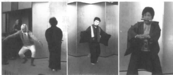
会員の皆さんの余興

総会終了後は、恒例の懇親会となり、会場は会員による見事なパッチワーク作品が飾られ特別ゲストによる手品ショー、ビンゴゲームに続きカラオケ、怪しげな踊りも飛び出し