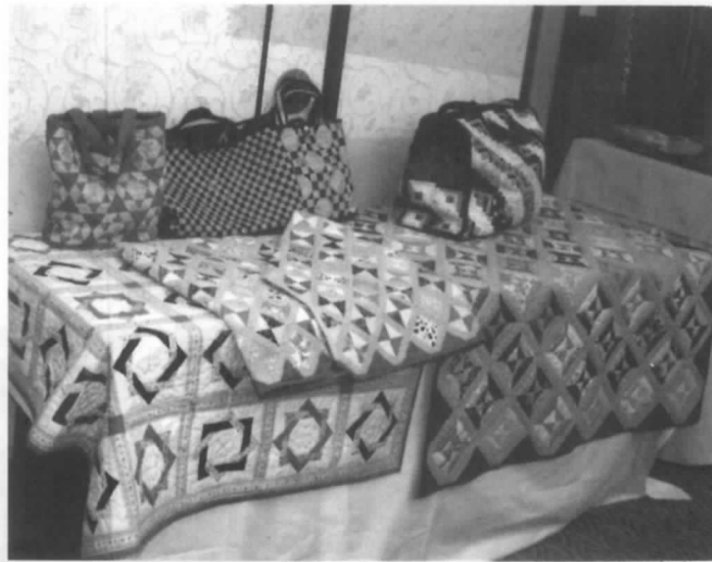
総会時展示された作品の数々

昔の仲間との語らいは何時になっても楽しく、若かった自分に帰るものらしい。40年以上の頃の?話に花が咲く。月に2回の集まりは、パッチワークの手よりも口の方が動いている。持ち寄った手作りの御菓子や漬物で盛り上がる。ボケ予防にこれ以上のもは無い。