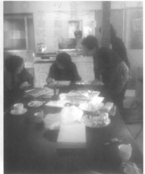
一つひとつついでにい