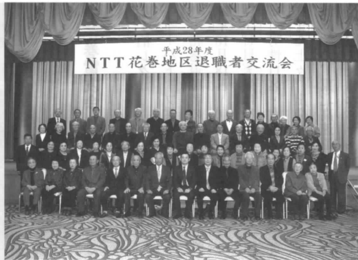
退職者交流会記念撮影

各テーブルでは、久しぶりに顔を合わせた会員同士が再会に感謝し互いの健康と次回の再会を誓い合うなど、澄み切った秋の日の楽しい1日でした。