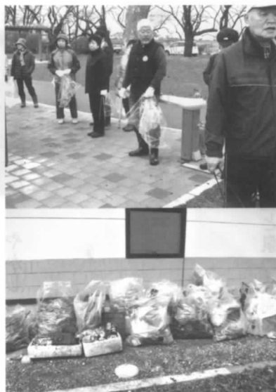
会員 35 名参加 早朝の奉仕活動で爽やかな汗！

園内利用マナーは年々良くなっているように見えます。また、園内の堤防工事も終了したことから、予想よりゴミが少なかったように思われましたが、少しでも「環境美化に役立った」との思いが参加者一人ひとりに感じられるひと時でした。 そして、さわやかな汗をかいた後に配布されたお茶とおにぎりで元気になり、「来年もやりましょうね」と声を掛け合っただけの散会となりました。