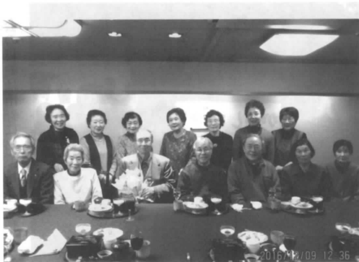
400回を迎えた 音楽を語り合う会

電友会会員の皆さん、ご家族、退職者の会の皆さんそして現役の社員、一般の人と当会ではどなたでも入会大歓迎ですので、是非入