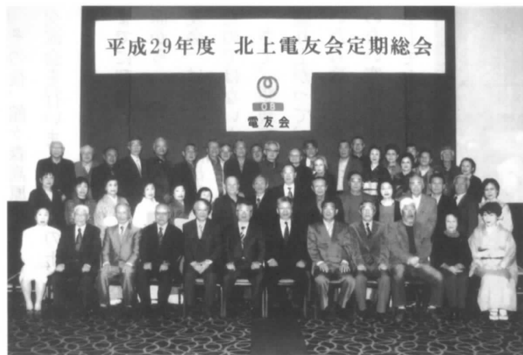
会員 51 名参加 北上電友会定期総会模様