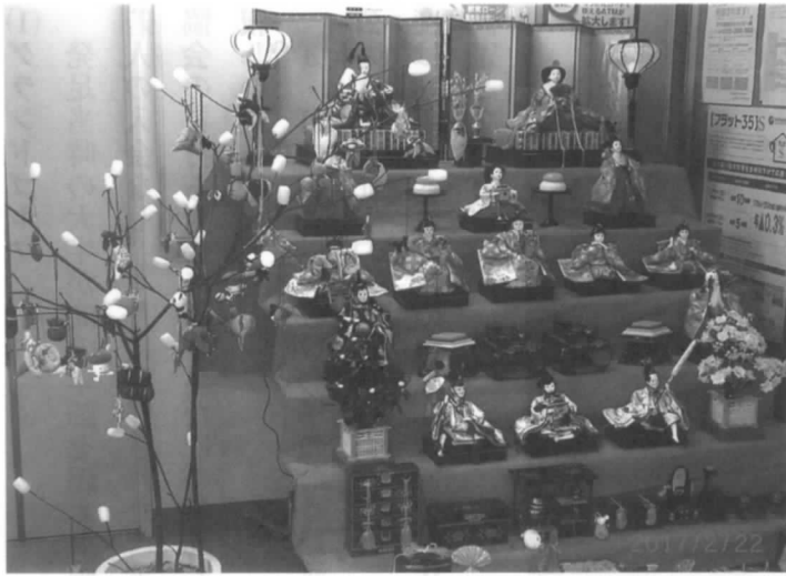
いつ見ても ステキなおひな様

様の心を和ませています。今年はいつもとちがう事をプラスしました。みづきびなをつるしました。女の子の成長を願って、きれいな布でいろんな形をつくりつるのです。それぞれに意味がありたくさんつるします。みごとですよ。1ヶ月ぐらい飾りとりはずした後はお茶会をし交流を計り活動の一環として継続しております。来年も頑張ります。