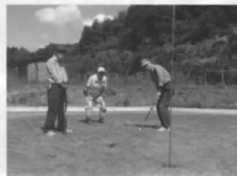
競技大会中のプレー模様