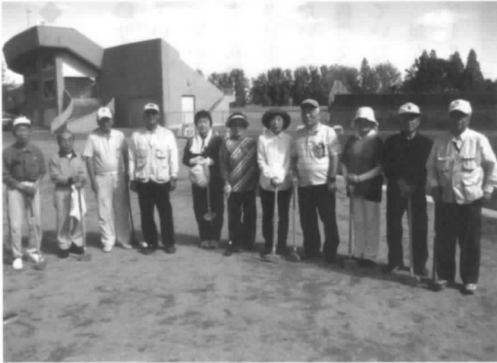
グラウンドゴルフクラブの皆さん

28年度休会していたパソコンクラブは、29年度から名称を改称しスマートフォンやタブレット等を中心に研修活動を行うことにし、次のIT講習会を実施。 月日 6月29日 参加者 23名 場所 男女共同参画プラザ 講師 ドコモ東北福島支店 内容 ①スマートフォンの基本操作 ②便利なアプリの紹介等 好評でしたので次回も計画予定です。 (5)グラウンドゴルフクラブ 会場の都合で活動が遅くなったが、広く新