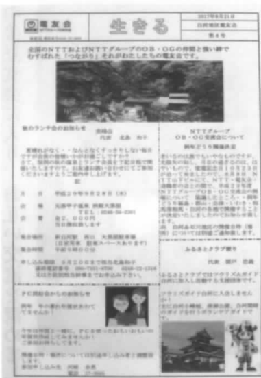
「生きる」(白河地区だより)

生きる(白河地区だより)の発行及び総会資料や年賀ハガキの作り方等月1回開催しています。