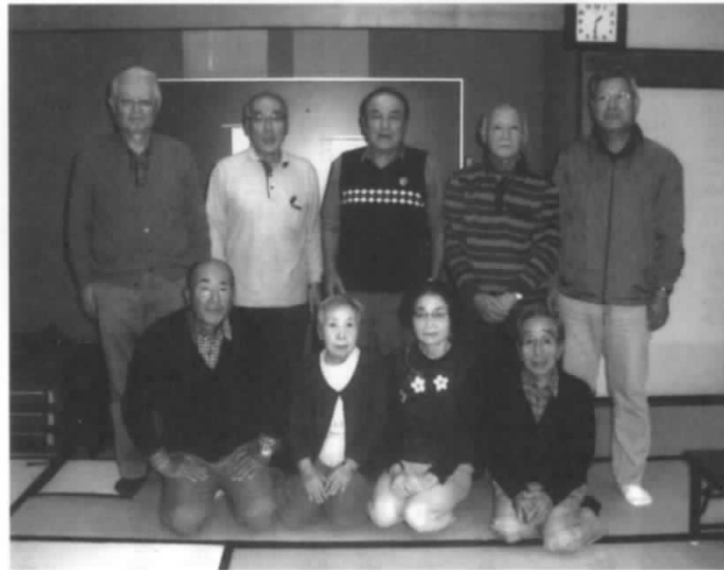
和気藹々と活動しています

例会は月1回を原則として真剣な中にも和気藹々をモットーに楽しく活動しております。6月に福島県支部親善囲碁交流会があり当サークルから9名が参加し活躍しました。今期も女性の活躍が目立った半期でした。