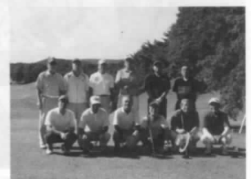
第200回大会 福島カントリークラブ アウト1番ティグランド