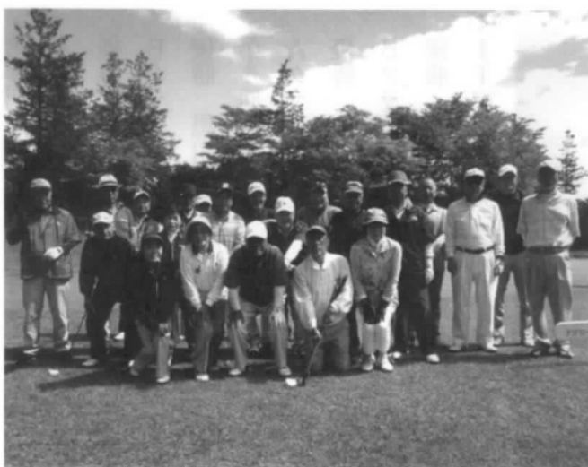
みんなで元気よく笑顔で！ パチリ！

新メンバーが増えています。しかし、歳のせいかわ腰が…足が…具合が…と止む無く休会・脱退せざる得ない状況があります。県南OB会のメンバーは36人です。