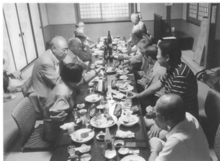
会議後の納涼懇親会様様