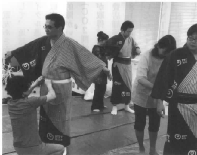
着付けのお手伝い

毎年、郡山市の夏祭り「うねめ踊り」が開催されますが、NTT(グループ企業含め)参加にあたり、電友あさか会の女性会員が例年着付けに協力しており、8月4日、4名の会員が着付けのお手伝いを行いました。