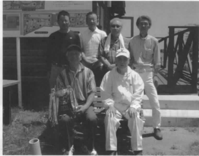
第67回パークゴルフ大会に参加された皆さん