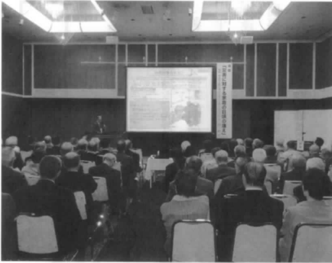
講演会会場の模様