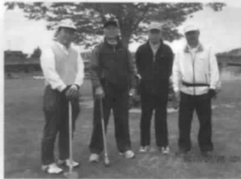
南相馬との交流グランドゴルフ大会に参加された皆さん

南相馬・相馬交流グランドゴルフ大会が南相馬市で開催され、相馬から4名の参加で交流を深めました。