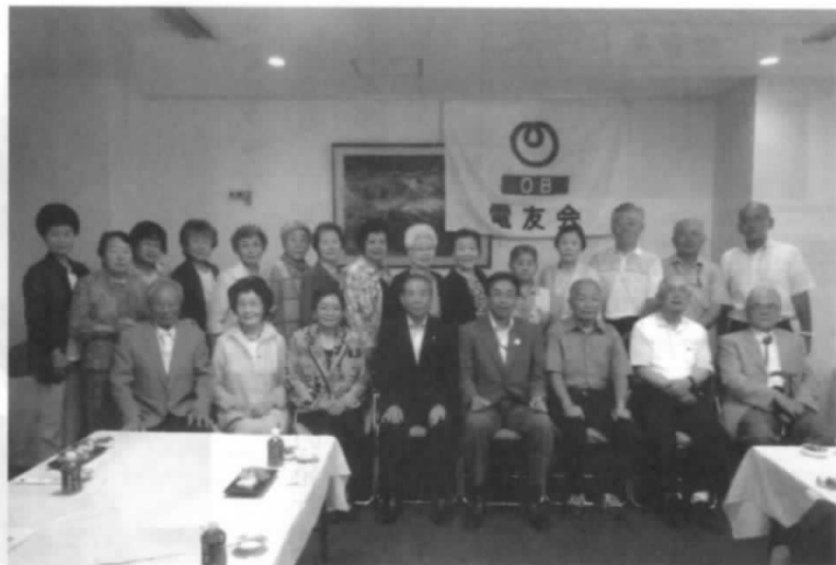
平成29年度 総会開催

議事審議の結果、可決承認されました。その後昼食会に入り、お互い交流を深めました。