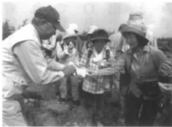
引っ張り餅のもよう

天元台が主催する「西吾妻山市民トレッキング」に参加、コースは前回(2年前)同様初心者向けの「人形石コース」としました。