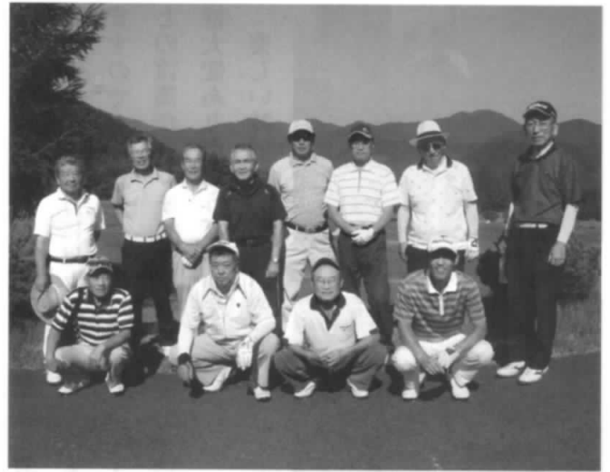
第201回大会 猫魔ホテル猪苗代コースハウス前にて