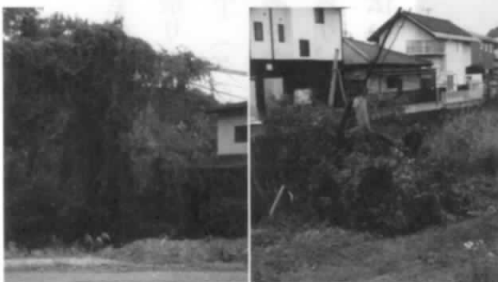
不良設備 樹木絡まり

NTT事業協力として、所外等不良設備情報提供①富久山北線12号(電柱傾斜)②同線12・13号(ケール倒木と接触)③同線14号付近(注意標識破損)④同線16号(電柱に樹木が絡まる)の情報を郡