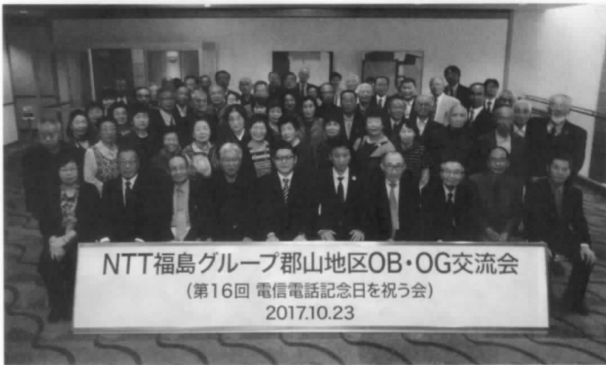
NTT 福島グループ郡山地区 OB・OG 交流会 記念写真