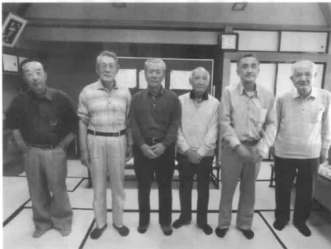
各クラスの入賞者

平成29年6月8日郡山市逢瀬荘において、第4回福島支部管内囲碁サークル交流会が開催されました。