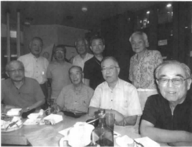
発表会参加の皆さん