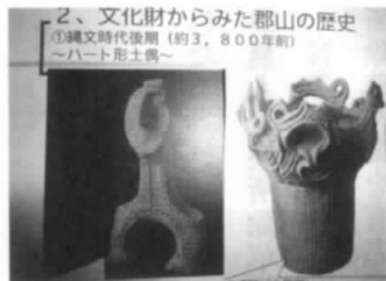
文化財からみた郡山の歴史資料

史と文化財について学びましたが、また各県の文化財に指定してもしよいかとの例を挙げて質問を交わすこともあった。