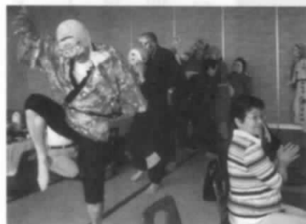
ひょっとこも登場し楽しいひととき

装・パフォーマンス。ひょっとこあり、七福神あり、おかめあり…。会場からは、仮装者の一挙一動の動作に、あのお面は〇〇さん?いや△△さんかしら??等々の笑いや励ましの声が絶えず、楽しい1日となりました。若葉薫る猪苗代湖湖畔の旅でした。