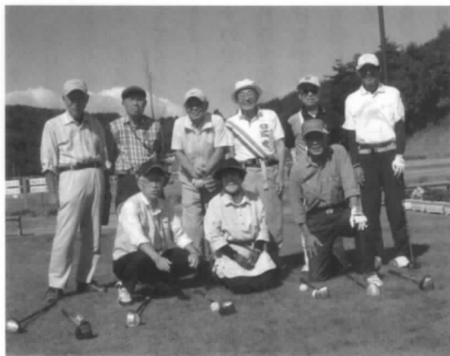
競技大会に参加した皆さん