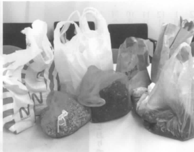
皆さんから寄せられたひまわりの種