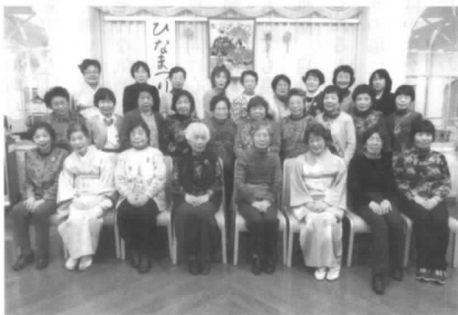
楽しかったひなまつり

です。駅前のホテルでひな祭りのためのお料理を前に出席者の皆を「おひな様」気分にならせてくれます。鯉のぼりは河を挟んで、何匹も泳ぎ、雛人形は一同に集められて飾られることが多くなった昨今、持ち寄った手作りのおひな様を前に出席者もおひな様気分にならせてくれます。着物を着ることが少なくなった今日この頃「着物で」と呼びかけておりましてが年々少なくなってきました。 今年は40名の出席で歌あり、踊りあり、クイズあり、回答者には、うれしい手作りサークルから世界に一つの宝物の作品のプレゼントがありました。昔話に明日の話に話が弾み