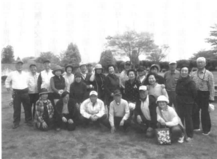
交流会参加の皆さん

4月27日、南相馬市原町区仲町河川敷公園グラウンドにおいて、南相馬・相馬退職者合同のグラウンドゴルフ交流会を開催しました。交流会には25名が参加し常日頃の練習の成果を発揮して、楽しく交流を深めました。グラウンドゴルフ交流会終了後、場所を食事会場の「旭亭」に移動して総会を開催、議案の承認を受けた後食事を取りながら、交流