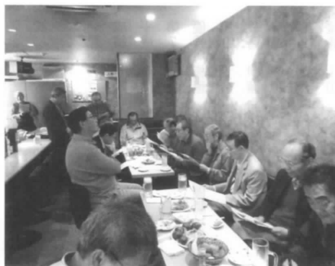
総会参加の皆さん

内スナックをお借りし開催しました。平成29年度の活動状況及び、収支決算状況報告・平成30年度事業計画及び、予算案についてそれぞれ承認され、新年度のスタートを切ることにになりました。総会終了後「観桜会」に移り、そばを肴に美味しい酒を頂き、楽しい一時を過ごすことが出来ました。