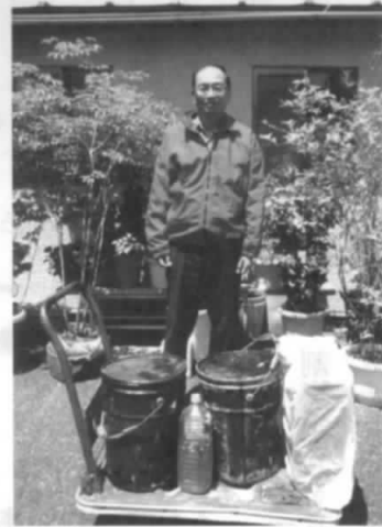
集まった食用廃油

が取得。会員並びにNTTグループと大口消費店舗等の協力を得て平成30年3月末累計で973ℓ提供いたしました。今後も継続実施いたします。