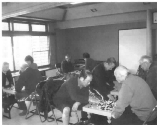
ふむ、ふむ、 そうくるかー