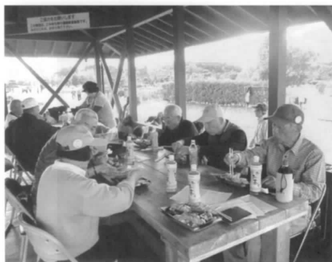
競技終了後の和やかな昼食風景