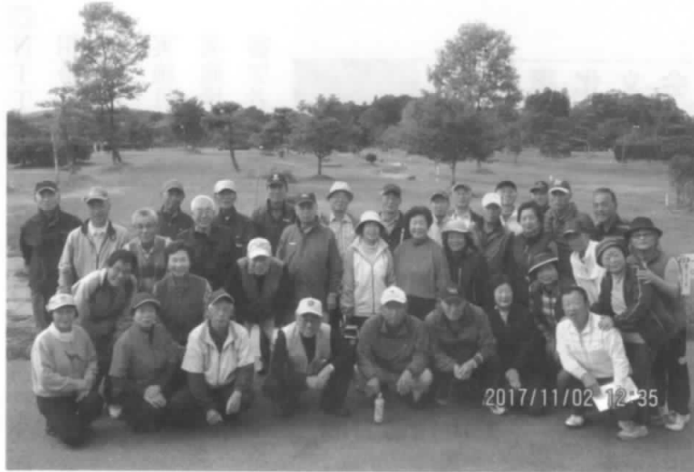
交流会参加の皆さん

平成29年11月2日、相馬光陽パークゴルフ場において相馬6名、南相馬22名、福島10名で第15回相馬、南相馬、福島OB親睦パークゴルフ交流大会を行いました。 大会終了後は成績発表があり昼食をとりながら大いに親睦を深めました。