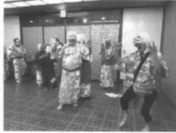
今回もひよっとこ登場!

宿に帰って疲れを癒したのちは、待ちに待った懇親会。今回も恒例となっている「仮装パフォーマンス」ひよっとこ踊りあり・女装者あり…見れば見るほどよか…着装者あり…等々で、「ヤジと笑い」に包まれた楽しい一夜を過ごしました。