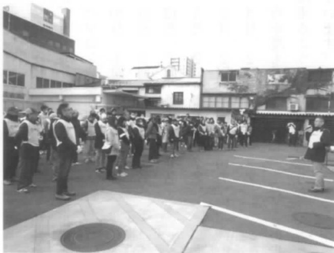
NTT福島山口支店長挨拶と参加の皆さん