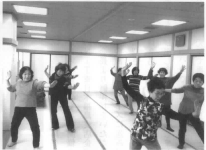
活動にピリオドを打つことに...