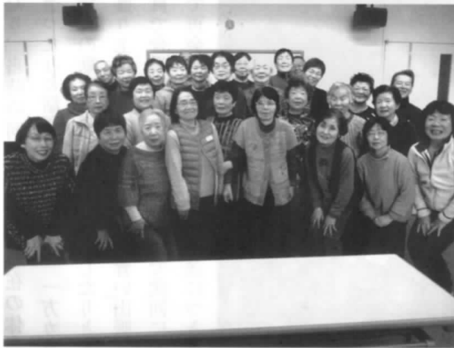
いつまでも健康でいたいネー