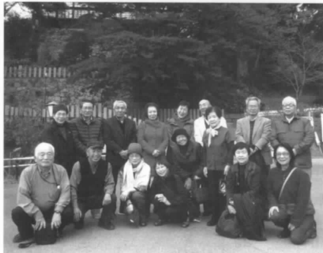
これからも元気で参加しよう!

楽しい楽しい旅行でしたが、今回の旅行を通じて特に感じたことは、参加者一同・お歳を召され、「高齢者」になってきているということですが、これからも「小旅行」は我々の生き甲斐でもありますので、続けていきたいと思えます。