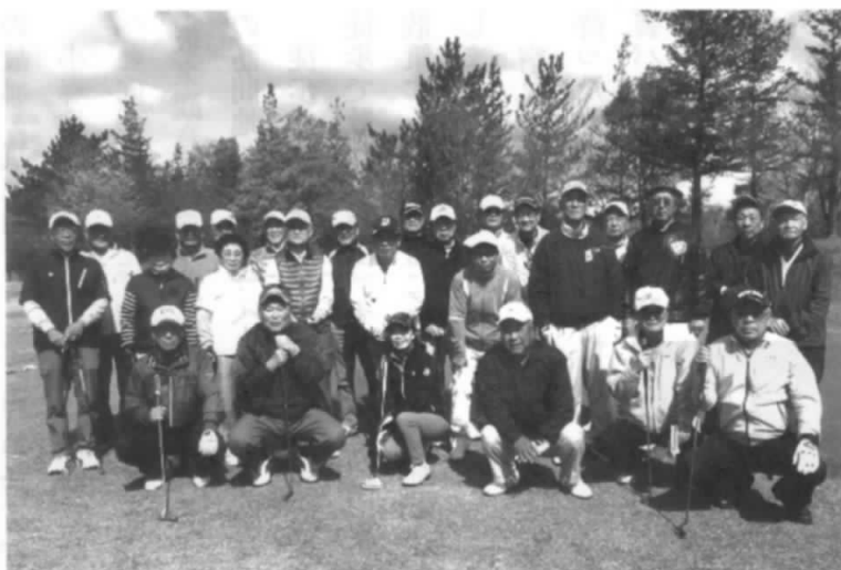
きょうも天気よし！ 気分もよし！