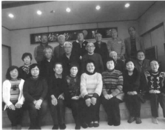
「青い山脈」を 全員で合唱しました

だり、当時の同僚の消息や現在の体調を気遣ったりと話題が尽きません。一方カラオケで昔の歌を合唱したり、熱唱したりと大いに盛り上がりました。最後に「青い山脈」を全員で合唱し、いつまでも健康で次回にも元気で再会出来る事を期して、帰途につきました。