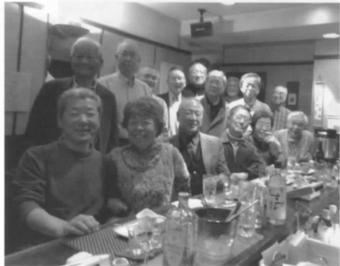
総会参加の皆さん