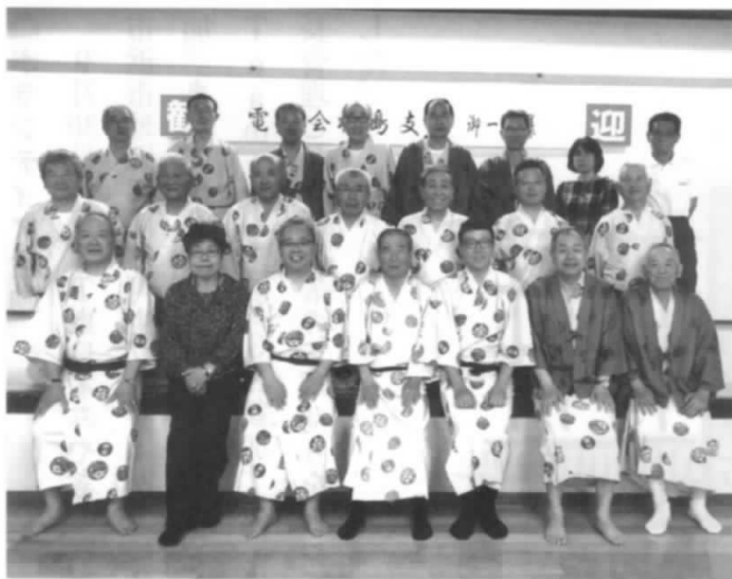
交流懇親会参加の皆さん

2日目は、新規入会者の拡大施策等について事務局から報告と周知を行い散会となりました。