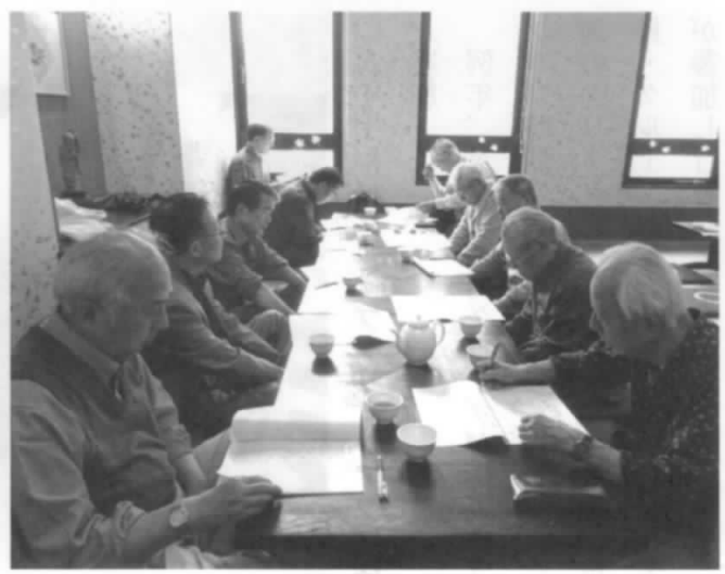
総会参加の皆さん