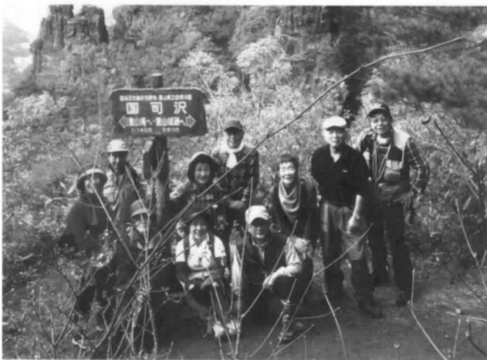
体力にあったペースで!

そして熟練した山の知識や情報、的確な判断力でいつも安全で楽しい山歩きに導いてくれる我が倶楽部の山案内人に感謝です。