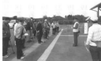
相馬地区草野会長の開会のあいさつ