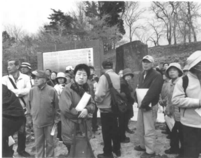
ぐるり白河文化遺産巡り

河市の150年前、江戸時代から明治時代に変わる歴史的転換期に西軍(薩摩・長州・大垣・忍藩)と東軍(奥羽越列藩)が慶応4年5月1日(1868年6月20日)戊辰戦争白河口の戦いがあり、東軍700名以上の戦死者を出した場所に、住民が東西両軍の戦死墓を立て、慰霊祭を毎年行うなどの香華を手向ける歴史があることを私たちは知りました。