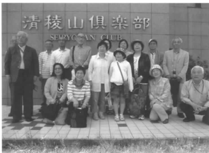
ニッコリ・ハイ・チーズ