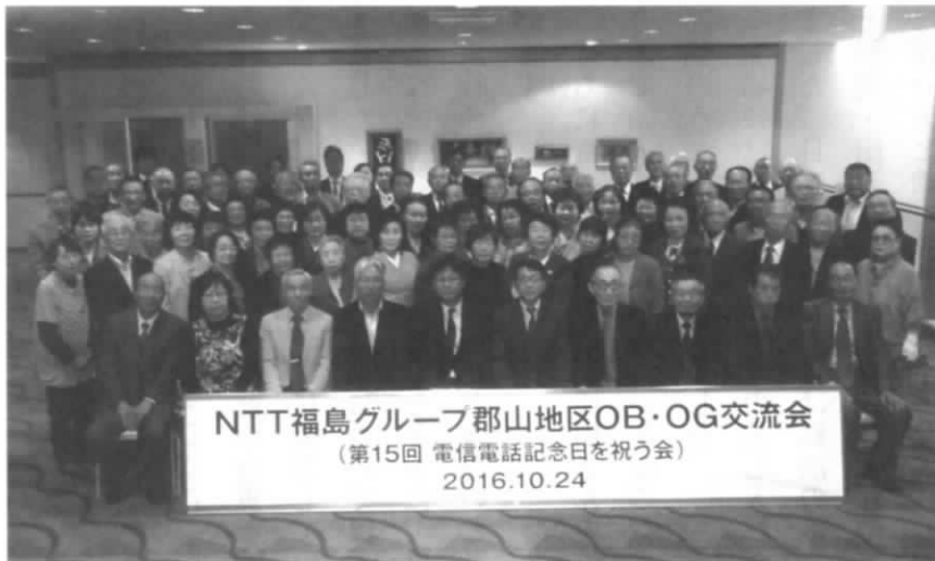
NTT福島グループ郡山地区 OB・OG交流会記念撮影