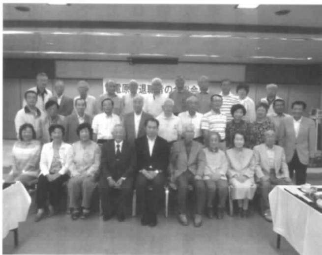
電電原町退職者の会総会