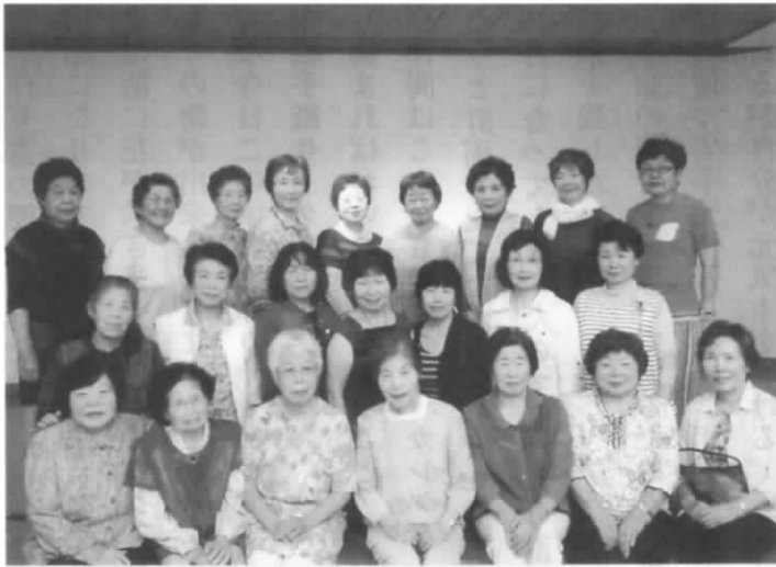
写真とりますよー！ はい笑ってー！

平成28年6月29日梅雨の晴れ間の1日を土湯温泉の福うさぎに24名が参加し行なわれしました。旅館は全館が畳敷きになっており廊下もスリッパを履かずに歩けるので私達高齢者にとってはお気に入りの廊下でした。 お食事まではお茶とお喋りに花を咲かせ、年に何回かは会っている友でも新鮮な気持ちで話せるのは昔の仲間のせいでしょうか。いよいよ魚料理が美味しいとの噂の食事の時間です。それぞれに配られた舟盛りのお刺身、焼き魚等々食べきれない程のごちそうでした。お腹いっぱいになったところで今度は楽しみ