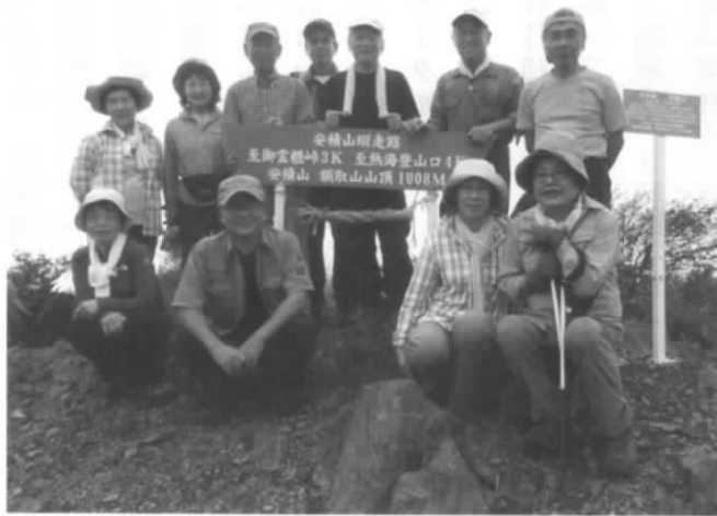
やっぱり山はいいねー

かりしていると前の人が見えなくなる。ましてや誰もが無口、吐く息だけが気になる。下山の1人にお会いする。「頂上は涼やかな風が流れて気持ちがいいですよ。ちょっと登ると頂上と勘違いする所がありますが、そこではなく、もうひと踏ん張りですよ」の情報。仲間がおにぎりを1個食べたころやっとたどり着いた頂上は真っ白、何も見えない。しかし心地よい風は頂上だ。そこへヘリコプターの音。「なに」見えない！霧を運んでくれた。見えた。「郡山」消えた！こっち猪苗代湖！消えた。(残念磐梯山は見えない)「熱海の街はこっち」黄金色に色づいた稲穂絶景のご褒