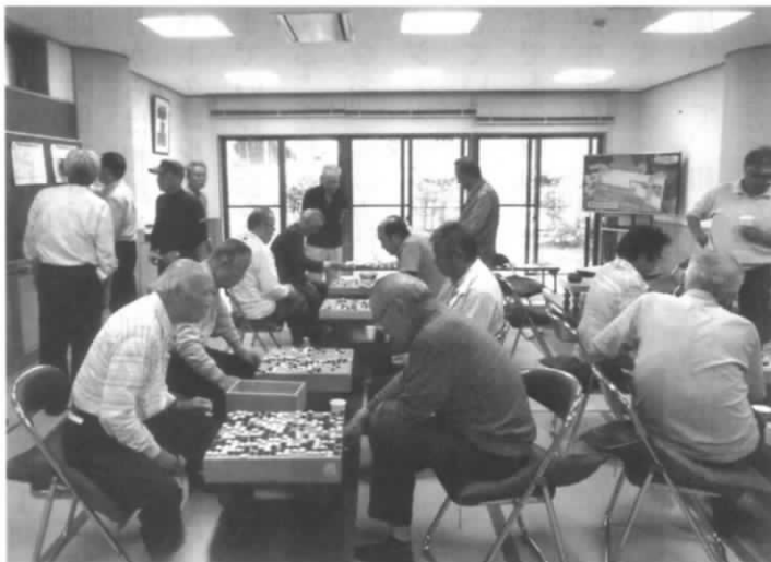
交流会対局の模様

・初夏大会は6月22日OBサロンで開催されたが、参加者は5名止まりとなり寂しい大会となった。