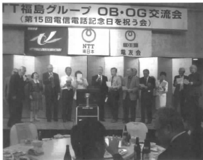
カラオケクラブ 「いつでも夢を」