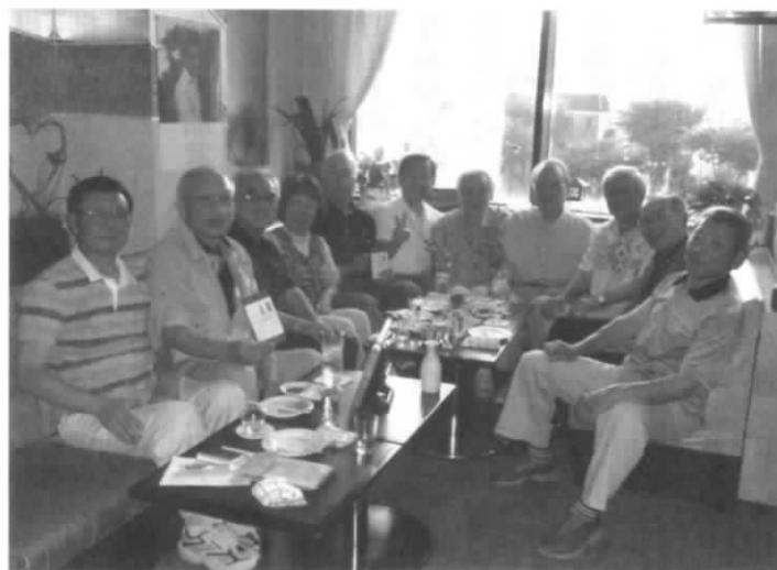
発表会参加の皆さん