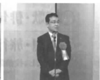
山内福島支店長主催者挨拶