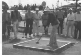
さあ、競技開始です

なお、競技方法はオリジナルのハンデ戦として、誰にでも優勝のチャンスが生まれ、毎回優勝者が変わるといふ励みも加わって、和気あいあいの中にも一打一打より大切に真剣なプレーが目立つようになって、大会開催のたびに大いに盛り上がっております。