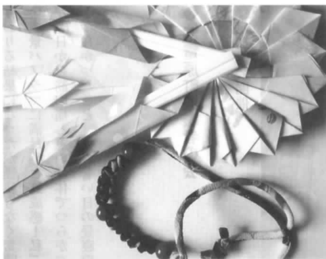
手作りサークルの作品

まるのが見えた。アッハッハ。 (2)手作りサークル 1日で出来る使える私の宝物。最近1日で出来るはなかなか思うようにはいかない。じっくりいい物を作りたいところですが、口はスムーズになめらかになるのですが手も一緒とはいかない。(これもよし) 28年は豪華なネックレス、折り紙で花瓶敷き、橋袋、立派なものです。ちょっとした心遣いが心に残る品です。