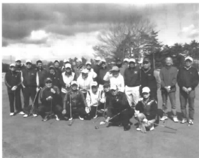
県南地区OBゴルフクラブメンバー