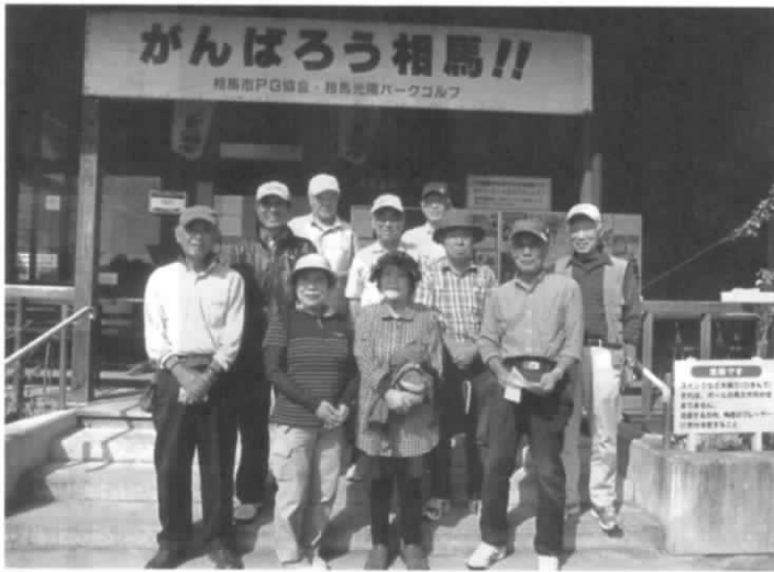
第3回競技大会参加者の皆さん

参加者は、それぞれ利用している練習場と本コースとのプレー環境の違いに改めて気づかされ、大変有意義な体験会となりました。 ・競技大会