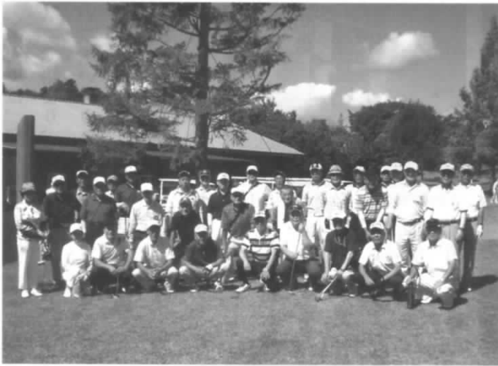
親善コンペ参加者 (パッティング場にて)

しのぶゴルフ倶楽部は、通年の南3県ゴルフ大会に参加するとともに、福島県内の県南ゴルフ倶楽部との親善ゴルフ大会を初めて開催し、久しぶりに会う人たちと楽しく語らい親睦を図ることが出来ました。