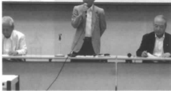
斉藤会長挨拶模様

会報等の配布は地域担当幹事が行い、会員との「ふれあい」を大事にした取り組みを継続する。また、例年行っ