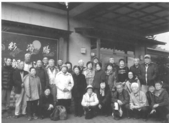
「青い山脈」を2度もうたっ てごきげんの会員の皆さん

つま先立について受講し、実技もストレッチ体操を中心に楽しく学ぶことができました。その後、日本料理膳をいただきました。ストレッチ体操と低栄養予防法を学んだ後だけに皆さんは完食でした。心身共々胃袋も満足し有意義なセミナーでした。