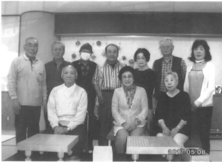
女性も活躍の 囲碁クラブ