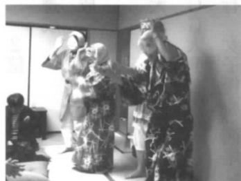
おかめひよつとこの踊りに 笑い小じわも増えて...