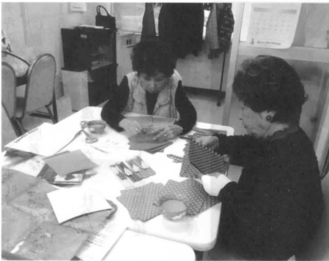
やってみようの 精神で…

員が半減(吾妻会の会員も同じ)。にもかかわらず『自分の宝物』を作ることと、介護施設への『クリスマスプレゼント』作成を受け継いでいる集まりです。集まれば賑やか、手元が思うようでもなくともできる作品は立派なものです。仲間がいればのこと。