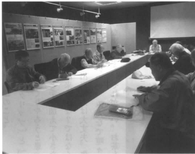
会員相互がITスキルの知識を出し合い...