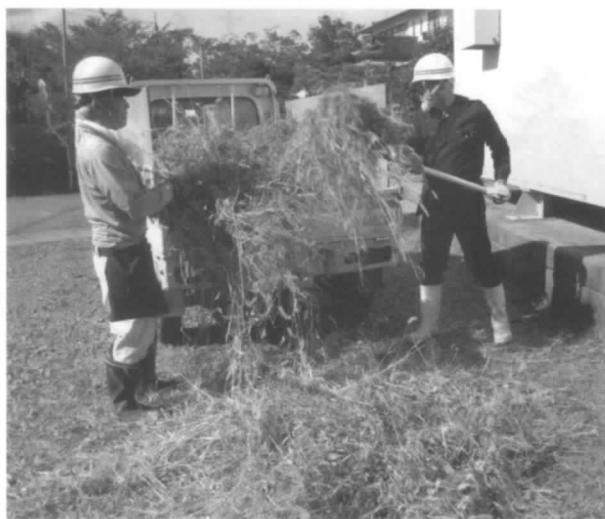
除草作業 おつかれさまです

電友あさか会と退職者の会共催の親睦旅行は数日前に降った雪が少し残る中、1月26日に実施しました。今年の旅先は2年前に行った矢吹町にある、「割烹温泉観音湯」です。今回は過去最多の30名の参加者となり、又参