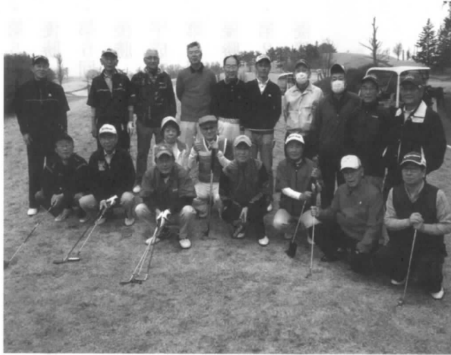
第195回大会 パーシモンカントリークラブ パッティング場