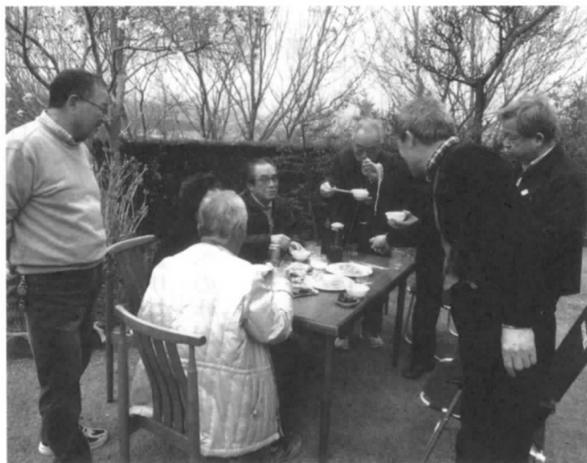
打ちたてそばの 食べ比べ

伏見師匠の指導で技術の習得、食べる専門の方は打ち立てのそばを御馳走になる。こんな集まりを月1回(第1水曜日)行おうと言うものです。