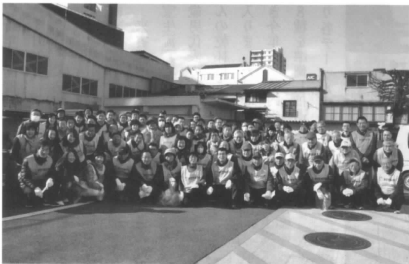
活動前の全参加者集合写真

例年実施しているNTT福島グループクリーンアップ活動は、平成28年11月26日グループ会社など関係者100名の参加のもとNTT大町ビルをスタートに市内中心部で行われました。電友会からは、福島地区12名、