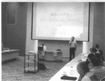
石井部長講演模様