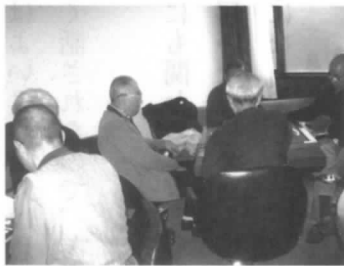
半世紀以上のキャリアを持つモサ

例会は3名の女性と雀歴が半世紀以上のキャリアを持つモサ6名で開始。 雀歴それぞれがしっかりテンパイ、テンパイ即、声高らかにリーチをかけあうなど麻雀牌の感触を楽しみながら仲間とのコミュニケーションが図れた1日だった。 結果は、熟女雀師が連続制覇。前回の覇者は傘寿を越した熟女。今回は古希を数年前に祝った熟女。 引き続き女性の強さ・たくましさ・勝負強さを知らされました。