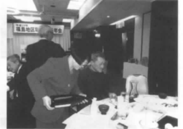
銘酒を楽しむ参加者