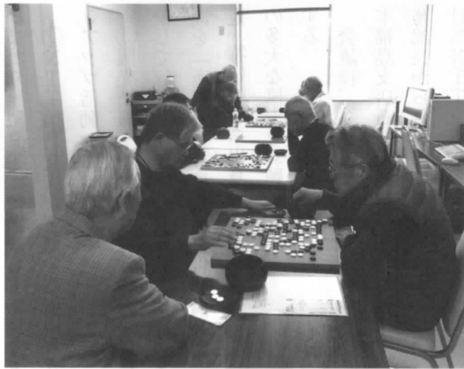
総会後の観桜大会模様

・第4回福島支部管内囲碁交流会は6月8日郡山の逢瀬荘で20名程度の参加を得て開催予定です。