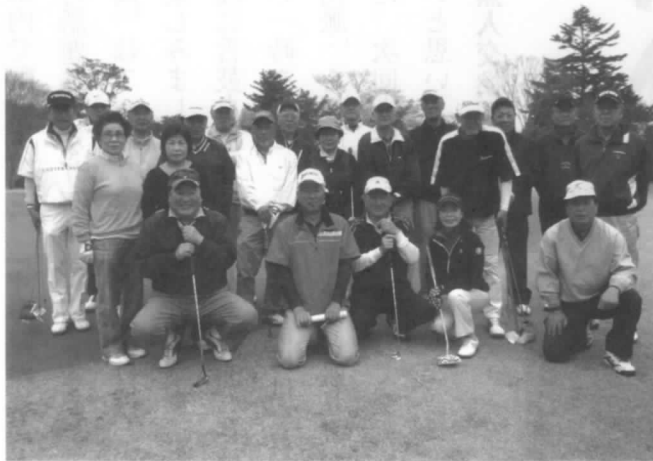
ゴルフクラブの面々

28年最後の大会は11月21日総会を兼ねて開催しました。80歳を超した会員(男女5名)も元気でプレーしている事も併せて報告致します。