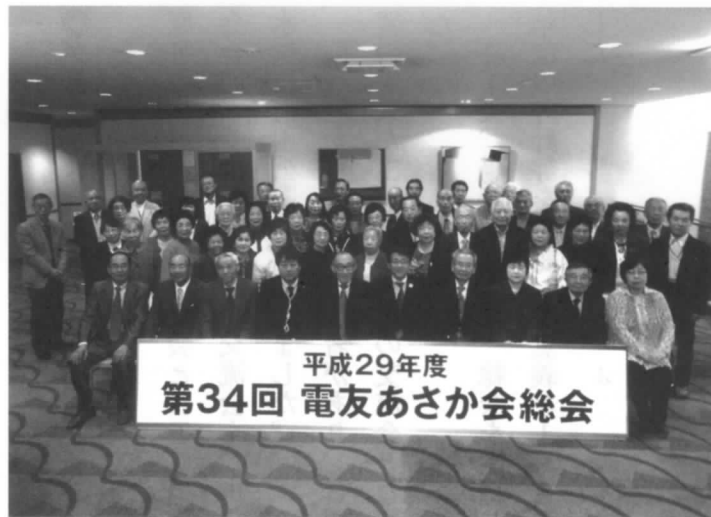
定期総会記念撮影

4月21日57名が出席し、ホテルプリシード郡山にて、和知郡山エリア支店長をはじめ多くの来賓をお迎えし定期総会を開催しました。