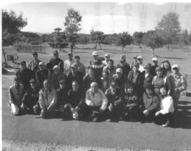
交流会に参加した皆さん