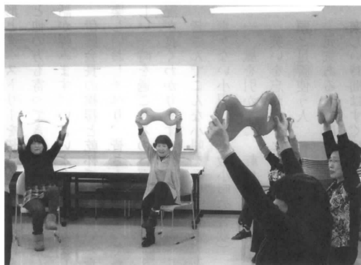
みんなで イチニツ!イチニツ!

の日は駄目なら空いているところに潜り込むしかない。今後電話での予約はどこよりも素早く。これをモットーに、老体にひとむちもふたむちも入れなければならぬ。