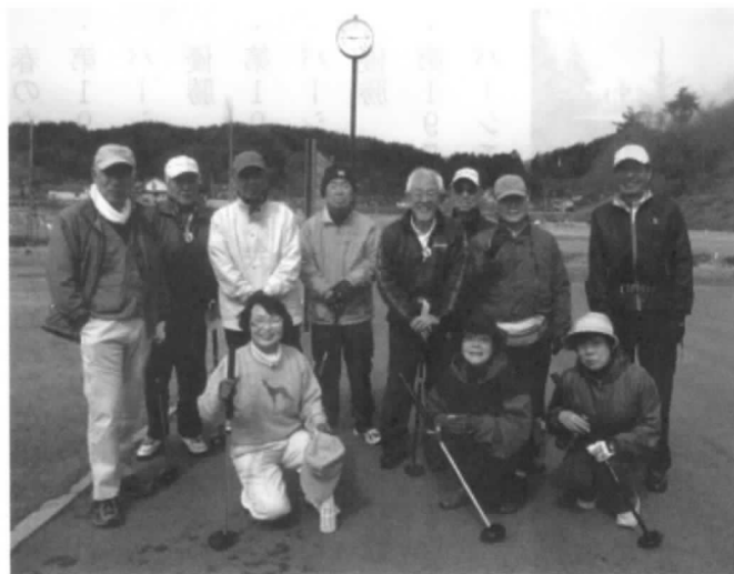
競技大会に参加した皆さん (H29年度 第1回)