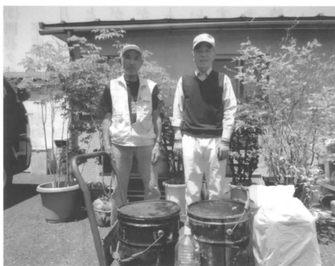
活動は今後も 継続していきます

電友あさか会発足30周年記念行事の一つとして、地球温暖化防止施策の「食用廃油リサイクル運動」を継続して会員が回収し、精製・販売は社会福祉法人「にんじん舎の会」(知的障がい者施設)がバイオ・ディーゼル燃料(CO2削減)化し、収益は「にんじん舎」が取得。会員並びにNTTグループと大口消費店舗等の協力を得て平成29年3月末累計で