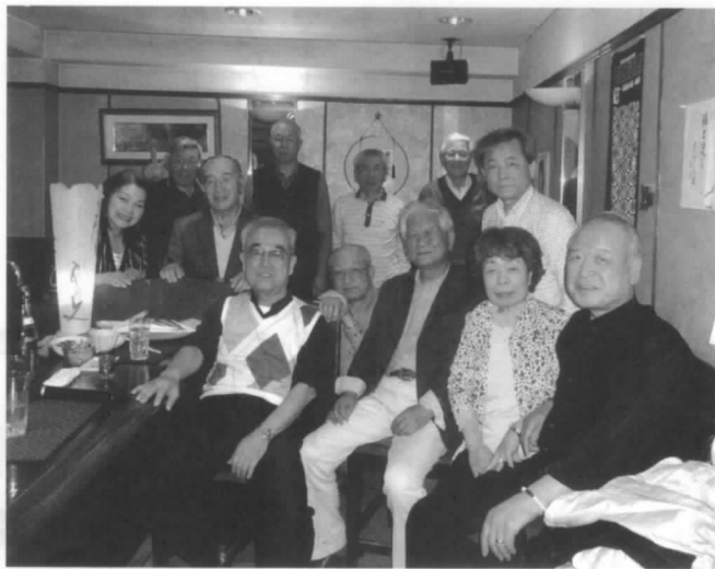
総会参加の皆さん

平成29年1月20日 新年会 10名参加 平成29年2月18日 例会 7名参加 平成29年3月18日 例会 9名参加 平成29年4月15日 定期総会 11名参加 平成29年5月13日 例会 8名参加 ・今総会の決定事項 奇数月 例会「カラオケボックス」で 偶数月 発表会「カラオケスナック」で