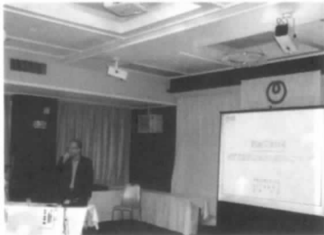
石井部長講話模様