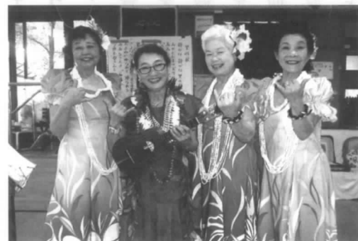
フラダンスボランティア記念

2月6日、会津青年会議所会館に於いて、退職者有志17名が燭台の残ロウ除去作業等のボランティアを実施いたしました。