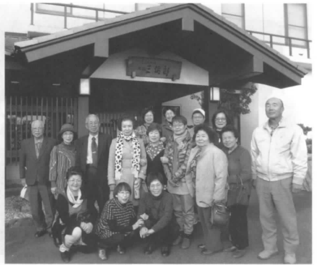
やっぱり 旅はいいねえ～