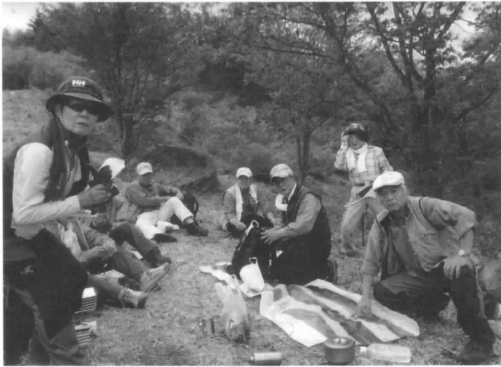
足腰きたえて さらに前進

力に加えて、登山後は、温泉で疲れを癒すことが恒例の楽しみと、自己の可能性にチャレンジする精神が原動力になって続いているのだと思います。 今年度は多くのメンバーに参加して貰えるように里山をメインに近場の中級の山を加えて計画しました。手始めに4月は飯館村「野手上山」へ11名参加。青空の下、山桜や若草色に芽吹いた『ケヤキの森』を歩き春のエネルギーを体感しました。今後は大火山・一切経山・磐梯山・遠藤ヶ滝・西吾妻山・安達太良山・霊山・鹿狼山・高松山・虎捕山・信夫