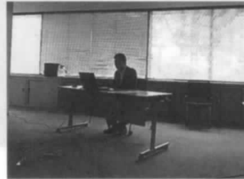
NTT 東日本井沢青森支店長

沢青森支店長で、「固定電話」のIP網移行に向けてです。ここ数年でIP網へ移行し固定電話やインターネットサービスがより安く使い易くなります。2つ目の講話は、NTT東日本青森支店越川渉外担当部長（警察OB）で、「安全安心な生活のために」です。自転車盗難防止にはツーロックをかける。住宅侵入犯罪被害防止では、夜は内鍵をかける。特殊詐欺防止では、必ず誰かに相談すること、家族の絆で犯人を撃退する。2つの講話は興味深く、大いに参考になりました。