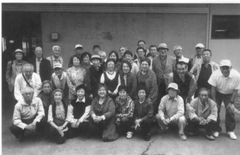
みんな元気で 合同レク参加

その後、施策の提案を含む議案すべてが満場一致で承認され、会員交流懇親会を開催しました。