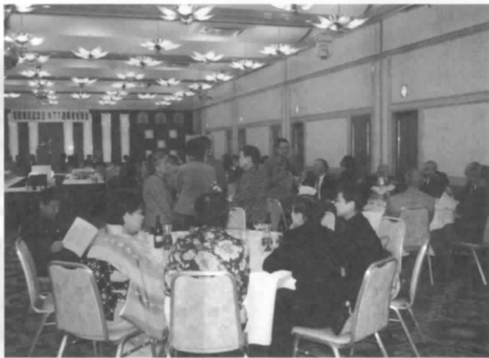
電信電話記念日NTT退職者祝賀会模様 平成27年10月23日