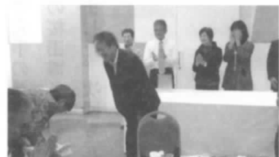
お楽しみ抽選会で当たりましたー!