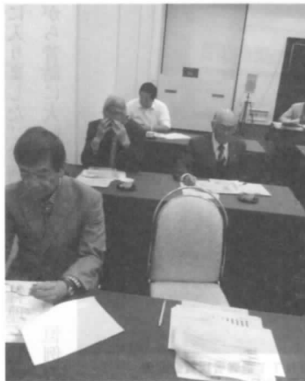
熱心に意見交換が行われました

今回の意見交換会及び懇親会で各災害対策連絡員の皆さんが、今後も地震・大雨・雷・平常時に発見した災害情報や不良設備状況を提供し、NTT青森支店に貢献していくことを意識合わせできました。