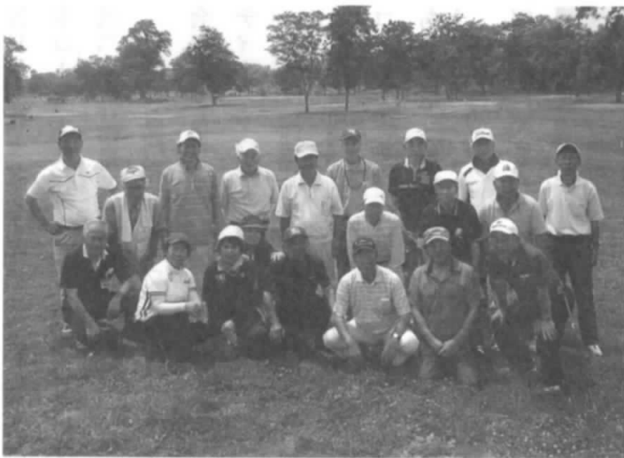
結成6年目を迎えた 弘前地区電友会パークゴルフ友の会活動模様

古川愛好会さんには88才になる方も参加されており、プレーの格好やしぐさは60代には負けず劣らずの元気さ。