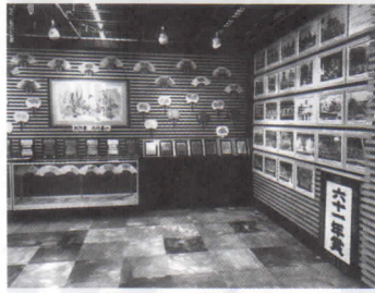
歴代ねぶた写真等展示

NTT東日本青森支店では、2年9月17日、NTT橋本ビル1階旧窓口を改装し、ねぶた祭の紹介やねぶた制作教室等の各種イベントを開催できる空間「ハネットステーション(H A n e t S t a t i o n)」をグランドオープンしました。