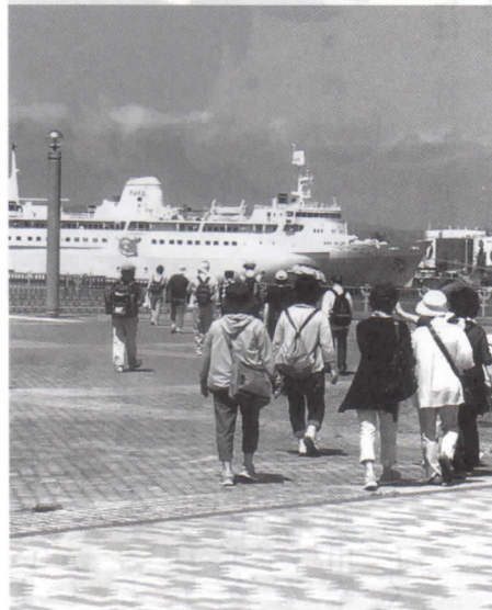
アスパム起点で3キロのウォーキング

・楽しく歩こう会 楽しく歩こう会サークルは7月17日、ウォーキングと総会を行いました。