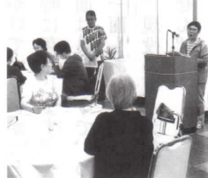
何かご意見はありますか～