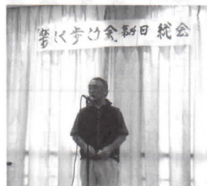
ウォーキング後の総会