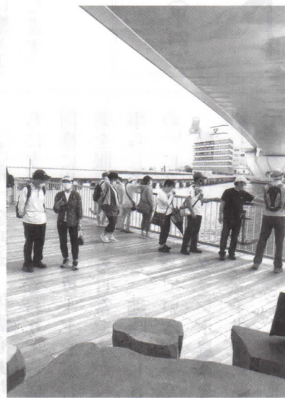
楽しく歩いて健康増進!