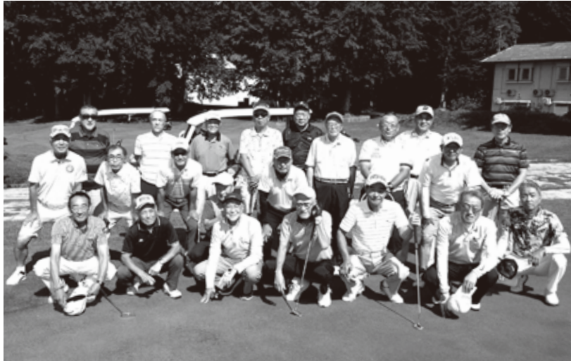
NTT-OB 青森ゴルフ会の皆さん 今回も素晴らしい記録を目指して