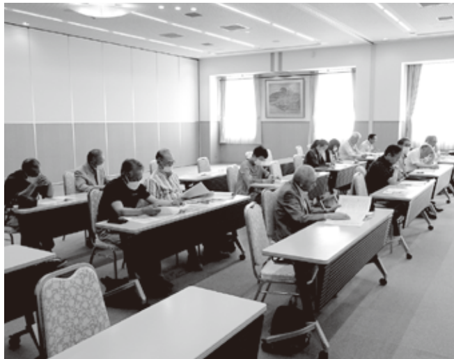
青森地区合同 総会模様

いが楽しく交流される活動」としました。各地区から、日々の活動内容の紹介があり、いろいろと工夫をしながら取り組まれている姿勢に、改めて電友会活動の重要さを感じました。質疑では、特に昨今の物価高による郵送費高騰に伴い、活動費圧迫の話題が出され、どの地区も共通の悩みであり、今後解決策を考えていきたいと思えます。