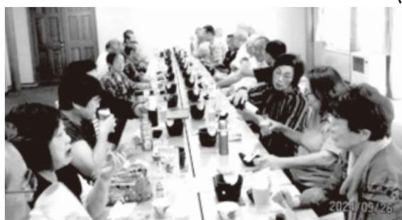
お風呂上がりのビールは格別