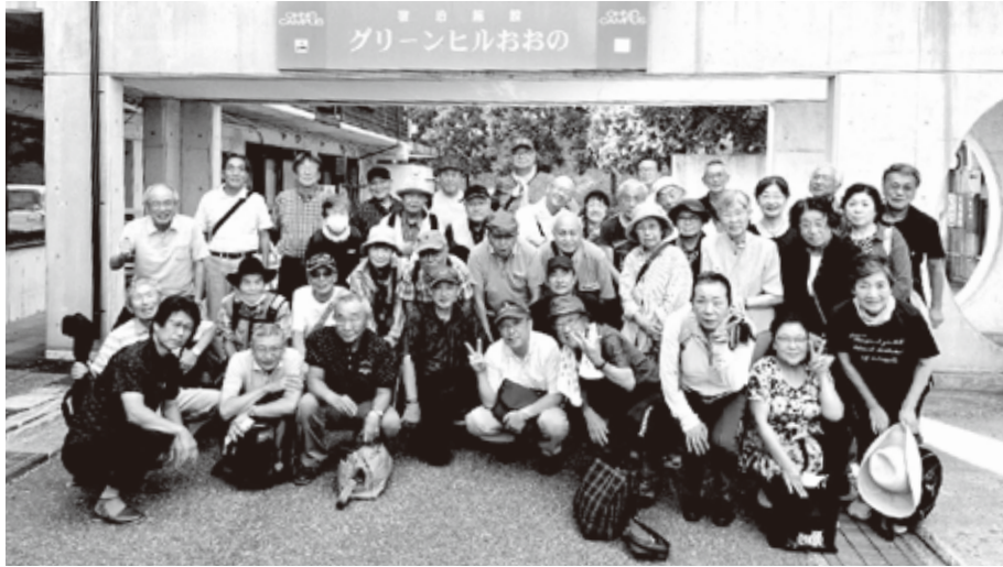
来年また 会いましょう

八戸地区電友会とNTT労組退職者の会とのNTT-OB会合同レクリエーションを、9月13日に参加者41名で岩手県洋野町大野にある「おおのキャンパス」で行いました。