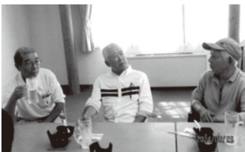
トランプ(4人カーン)で熱く語る

14時「つがる地球村温泉藤山亭」をバックに記念写真をとり、つがる地球村を後に。途中森田道の駅でお土産を仕入れて15時30分弘前駅城東口着。有志で三次会まで続く人達もいました。