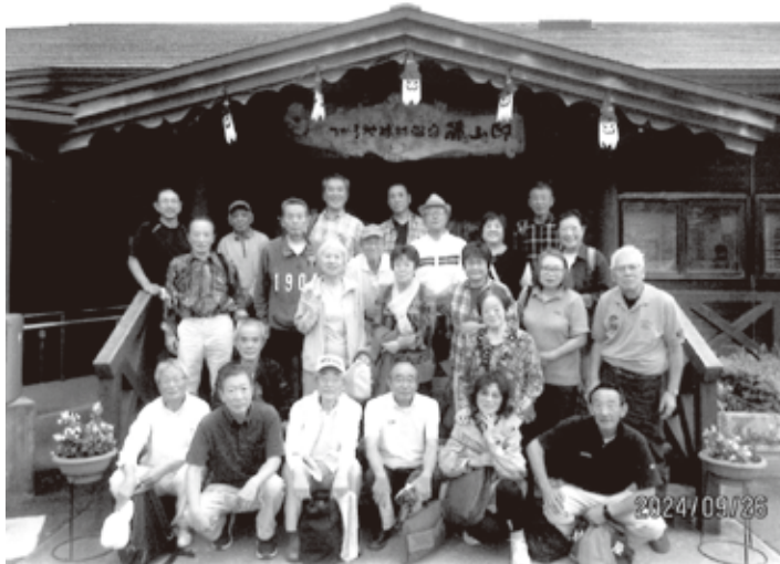
心身共に癒されてリフレッシュした笑顔の皆さん (藤山亭前にて)

合同レクについて、バス中、参加者全員にアンケートを募り、一泊or日帰りか、併わせて今回の感想をお願いしたところ『近場で日帰りがよし』『現状のまま』が大方の意見でした。また、トランプでできるなら次回も参加したい、との感想もありました。 レクについては来年度も継続いたします。