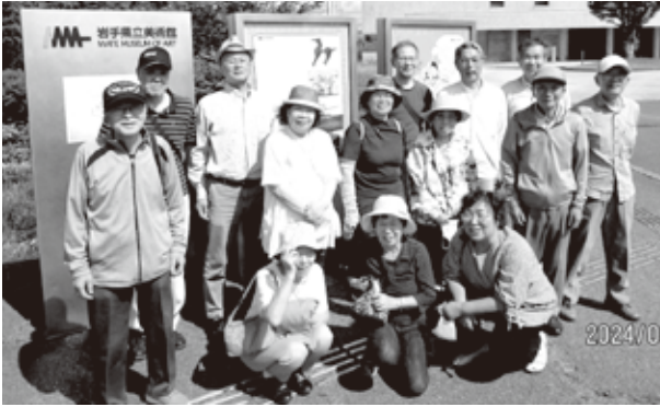
【日帰りレク】岩手県立美術館の前で！

数年ぶりの日帰りレクは6月26日に行い、14名が参加しました。石神の丘美術館や葛巻高原でラベンダーを見たり、岩手県立美術館では格調高く「川端龍子記