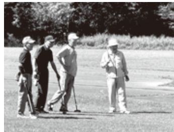
ショット前のコース確認