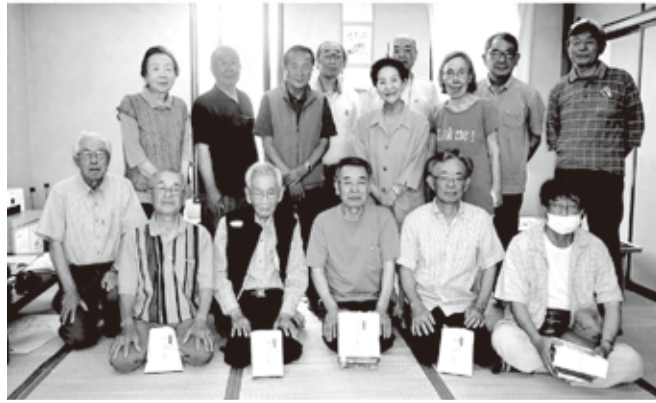
遊友クラブ 麻雀大会 令和6年6月21日 6月大会