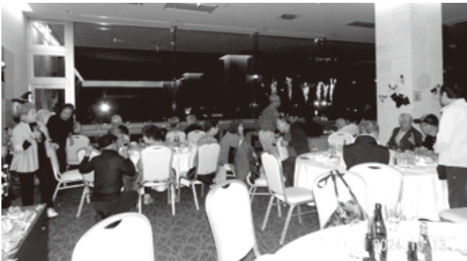
酒に、料理に酔いしれる