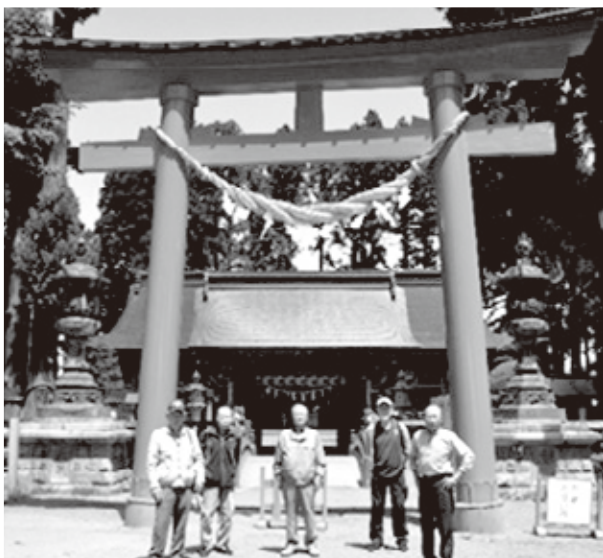
ITだべり会 日帰りレク 櫛引八幡宮

ル・印刷スキャン等、日常使用する機器の機能の情報交換でスキルアップを目指している。またIT会の日帰りレクは、「八戸日帰り散策」を5月25日に実施した。会員の全国百名城探訪の楽しみを借用し「八戸根城」を目ざした。周辺の「櫛引八幡宮」「八食センター」での昼食、「ウミネコ繁殖地蕪島」「自然の芝生が一面の種差海岸」を堪能し、久慈・宮古・釜石の三陸高速道路を利用し旧南部領を一周した。これからも仲間の皆さんの参加をお待ちしています。