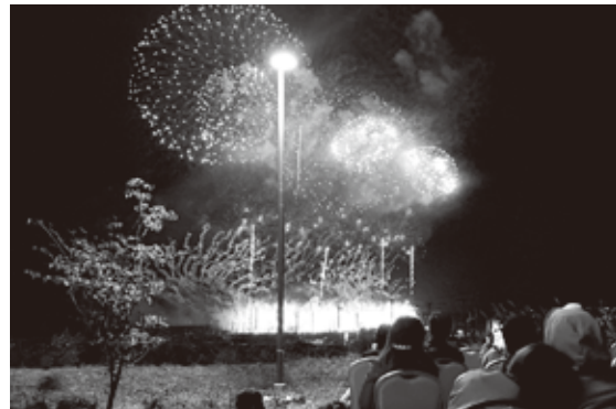
光の大輪に酔いしれる

今年度のレクは10月13日、陸前高田市で開催される三陸花火競技大会をキャピタルホテル10000のホールで観覧しました。34名(男18名、女16名)の参加で飲み放題、食べ放題2時間のバイキング方式。晴天に恵まれ、秋の夜空を彩る花火師自慢の1万5000発の光の大輪に酔いしれながらの飲み、駄弁りゝは、今までのレクでは経験したことがない楽しいひと時の鑑賞の過ごし方でした。