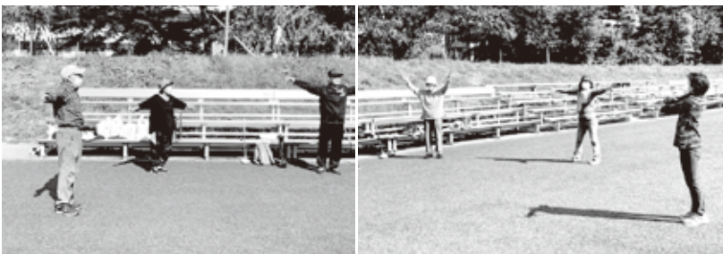
無音のラジオ体操。自然と体は動きます。