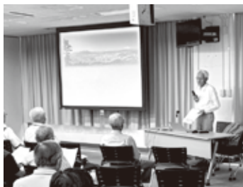
スライドで説明 下山講師