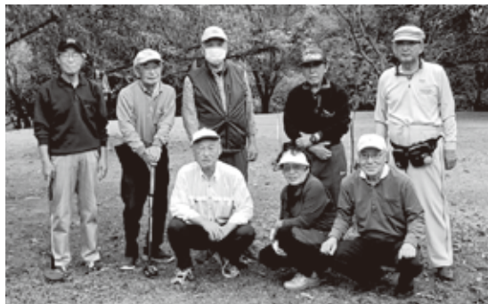
グラウンドゴルフサークルの皆さん

令和6年度は3月30日から展勝地グラウンドと樺山遺跡公園を使って練習を始めました。ワイワイ騒ぎながらのプレーと、休憩時間に語らう健康の話や尽きない雑談など、