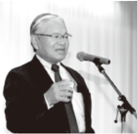
退職者の会千葉会長