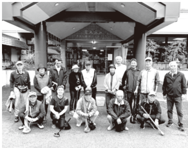
ひと汗かいた後の温泉は最高 温泉の後のビールもまた格別

花巻電友会では、前回から市内の温泉施設を利用し、送迎バス付きの日帰りレクを実施しています。施設内グラウンドゴルフ場でのグラウンドゴルフ大会、周辺の山をトレッキング、隣接する県営広域公園での園内散策等、参加者が希望する楽しみ方で行い、散策等の