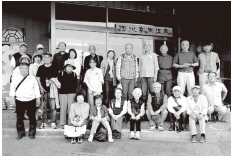
女性パワー満開の楽しいレクでした

そのパワーが数十年前の現役時代を彷彿させる楽しい話題に花が満開といった感じでした。