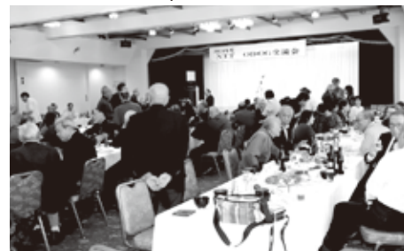
久しぶりの再会にお酒も進みます

日、令和6年に「中尊寺建立から900年」を迎えた平泉町のホテル武蔵坊で開催され、