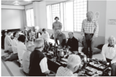
昔話に時間が経つのも忘れます

そのパワーが数十年前の現役時代を彷彿させる楽しい話題に花が満開といった感じでした。