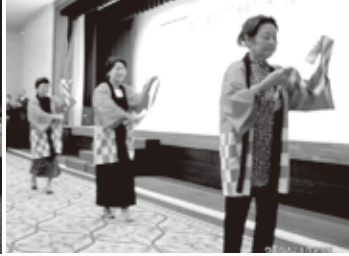
交流会の余興(久慈) 「久慈湾小唄」踊るベッピン娘