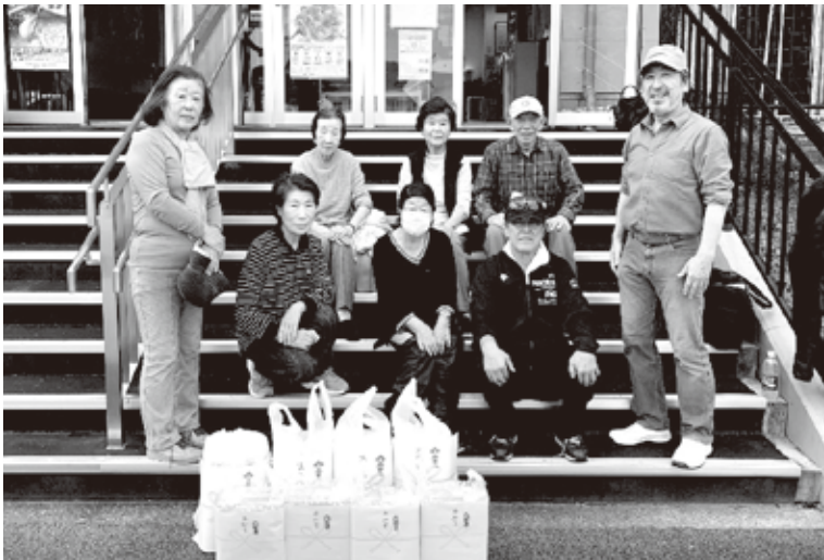
豪華景品に 皆さん笑顔

々木健二会長の挨拶。続いて誰かが「準備体操ー！」と声を掛けると、みな自然と輪になり、元氣良いかけ声を発し体操を誘導する者が出る。その声に皆が動きを合わせ始め、笑顔の無音ラジオ体操が始まり、ゲーム開始となりました。