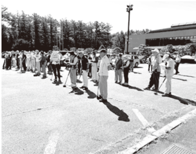
県内から集まった選手63名