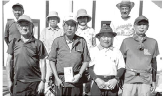
パークゴルフ同好会

午後から、奥州ふれあいの丘で健康と交流を兼ねて楽しんでいる。今年度は定例日になれば雨模様の日が多く「また中止か!」と悩まされた中、7月22日に大会を開催した。成績は次のとおり。