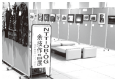
展示コーナー入口・写真コーナー