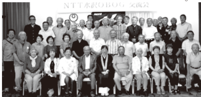
講演会&懇親会の記念写真

らす」人になることで豊かで平和になる、一 人ひとりが自分の場所で光り(ポストにベス ト)、周りを照らすことを積み重ね(支え、 支えられ)ていくと「網の目」が「網」にな りネットワークになること。また、映画「人 生フルーツ」の 話もされました。 老夫婦が小さな 事を楽しみなが ら毎日コソコソ 積み上げる人生 を豊かに生きて いる映画の内容 に感動。小さな つまらない事で も積み上げてい くと豊かに生ま れ変わる等々、 ユーモアも交え たお話は、日々の生活や生き方を見直して みる良い機会になりました。 講演会に続き講師を交えた懇親会は大変有 意義な会となり、久々に会う会員や新人会員 も交え楽しい時間を過ごしました。返信ハガ キを使用した抽選会では、10名の会員が発行 間もない「新紙幣」をゲットしました。