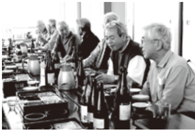
風呂上がりのビールでご満悦