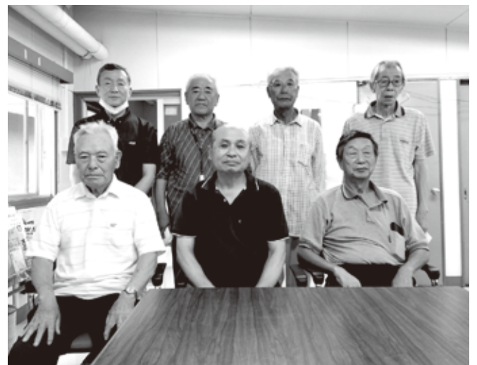
高松囲碁クラブの 皆さん