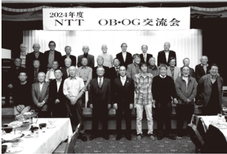
水沢OB・OG会の 皆さん