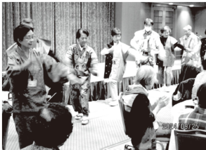
遠野電友会の皆さんの手踊り風景

ラクシオンは3人の遠野昔ばなし。また、締めは全員で「新遠野小唄の手踊り」と、流石のオ・モ・テ・ナ・シでした。