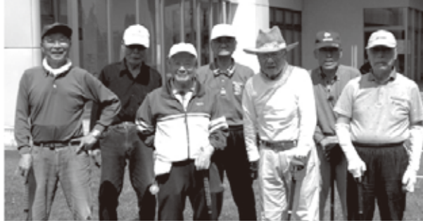
グラウンドゴルフ同好会

昨年6月5日、胆江地区広域交流センターにおいて同好会の親善交流大会を開催した。当日は朝から晴れて絶好のグラウンド・ゴルフ日和、3ゲーム24ホールを競い合った。芝生が長くなり、全員がホールインワンを一件も出せないばかりか、50mコースで半分の25m程度しか飛ばせず四苦八苦した人、練習の成果を発揮した人と様々で楽しい一日だった。成績は次のとおり。