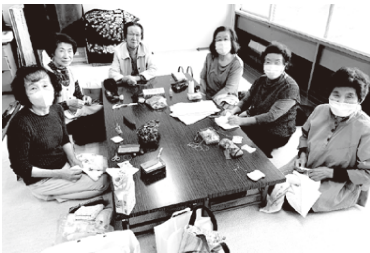
心を込めて 縫ってます

毎年12月は、まとまった数の雑巾と、多くはないけど寄付金を釜石福祉協議会にお届け