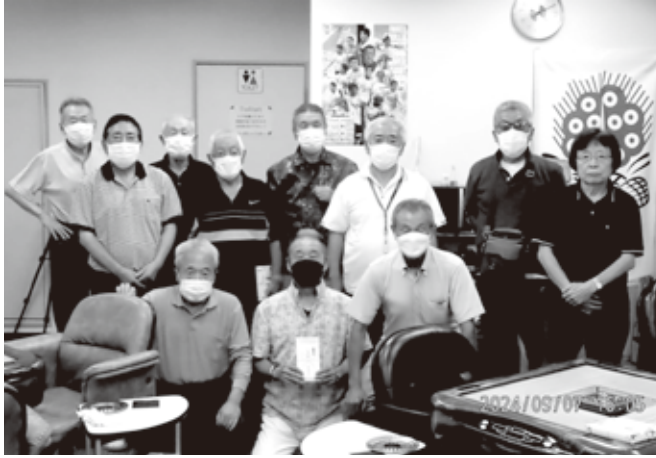
令和6年9月例会の参加者で 集合写真