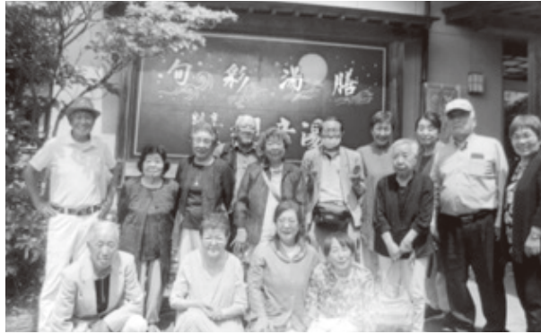
「観音湯」に浸かり皆笑顔