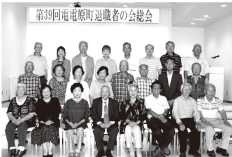
原町 6年度総会写真

令和6年7月10日、ロイヤルホテル丸屋グランドで24名参加のもと開催された。新規加入会員の紹介の後、総会議案が提案され、活動報告・方針について満場一致で承認、可決された。2部の懇親会では、参加者の近況報告やジャンケン大会で大いに盛り上がり、交流は盛会裏に終わった。