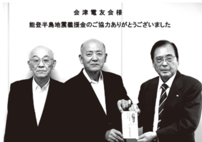
会津電友会様 能登半島地震災害義援金のご協力ありがとうございました

令和6年10月7日、喜多方市総合福祉センターにおいて文化講演会を開催しました。13名の方が参加し、「認知症トレーナーについて」当センターの職員の方に講演をいただきました。認知症の方の接し方、認知症の方の気持ち、その家族の気持ち等を講義いただき、これからの生活に役に立つ話を聞くことが出来ました。