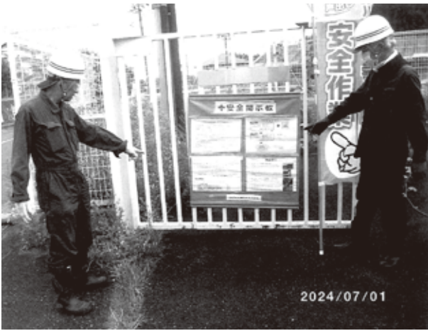
除草作業前安全確認 舞木交換所

これにより通信設備を目視で確認出来るよう、上下刃逆回転ハサミ式刈払機を使用しての除草作業により、ケーブル切断破損事故の作業事故発生は皆無となりました。