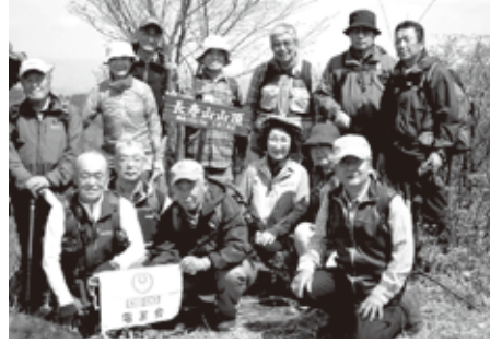
4月 長寿山・太郎坊山

山(満福寺)で昼食にし、「昭和羅漢」のユニークな石像達に癒され滝根町の「針湯荘」の湯で温まり帰路に着いた。