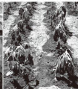
移植後のしおれ状況