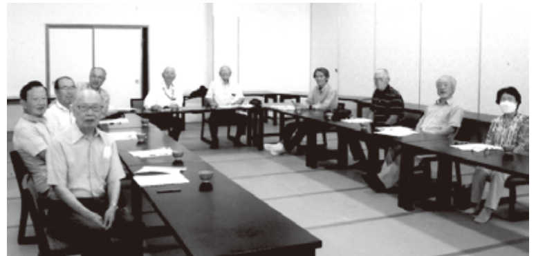
相馬クラブ R6 総会

令和5年度経過報告、会計報告及び会計監査報告の承認後、令和6年度事業計画(案)、予算(案)について議案を審議し、可決されました。