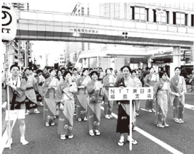
NTT 東日本福島支店の皆さん 着付けもバッチリ

か会の女性も例年どおり着付け手伝いに協力しました。祭り日程の8月2～3日、4名で着付け手伝いをしました。なお、参加数は60の団体・3250名の踊り手でした。