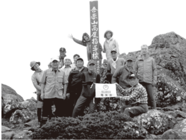
9月 西吾妻・人形石

登山日和で人形石からの吾妻連峰が絶景で登山道中の色鮮やかなリンドウの花や赤い実を付けたゴゼンタチバナが我々一行を歓迎してくれた。下山後は白布温泉の東屋旅館で入浴をし、秋を感じた良い一日でした。