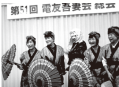
第51回 電友吾妻会 総会 踊り写真 吾妻会 総会踊り写真