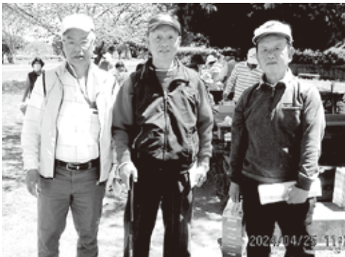
相馬クラブ 原町との交流会