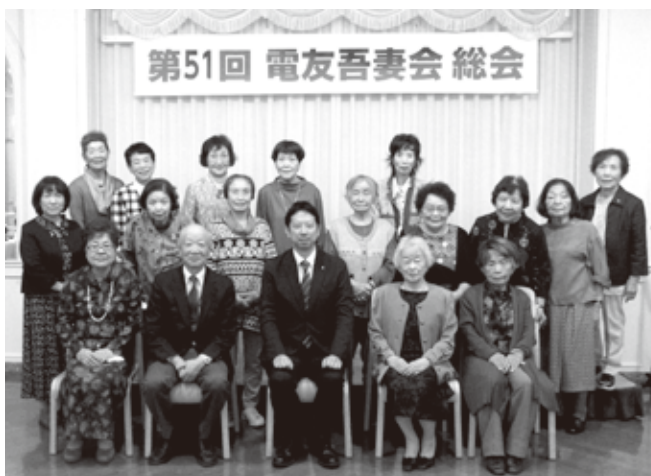
第51回 電友吾妻会 総会 吾妻会 総会集合写真

また、一日限りの「吾妻会芸能クラブ」の仮装踊りや歌があり、おなかを抱えて笑い、即席で皆も一緒に踊り…。そんな様子をみると、続けることは大切だなあと感じました。楽しい語らいをいっぱい、明日からの余韻に浸ることができるネ、と思いつながら散会しました。