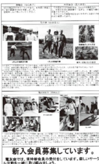
作成した会報誌19号 裏面