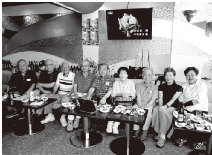
8月例会参加の皆さん

我がクラブは、皆で「しゃべり」「歌い」「飲んで」と楽しい集まりです。原則毎月第3月曜日が例会です、興味のある方は、来て見てください。来ない(来てみて下さいね)。なお、10月例会では年2回の発表会を予定しています。結果については次回号で紹介いたします。