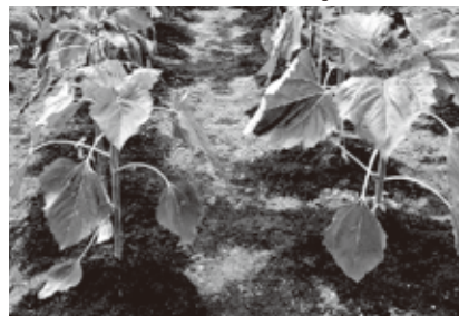
翌朝、元気になった状況