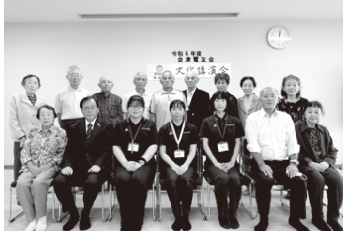
文化講演会参加者の皆さん 「認知症トレーナーについて」講演

昼食は、第2部として、芋煮会を実施しました。有意義な講義を受け、美味しい芋煮御膳を頂き、楽しい一日を過ごしました。