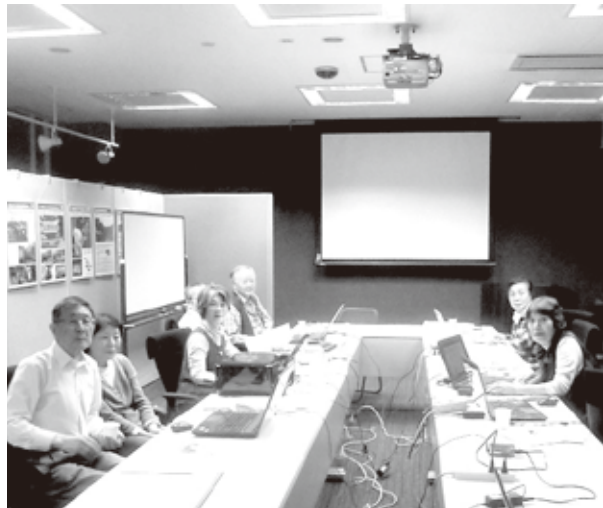
例会とPC教室の開催模様

また、有志によるボランティア活動として、視覚障害者支援組織「にじの会」へ図書のデジタル音声化を支援しており、多くの障害者の方々から喜ばれています。閲覧回数は、過去作成の図書も含めて2300回を超えました。