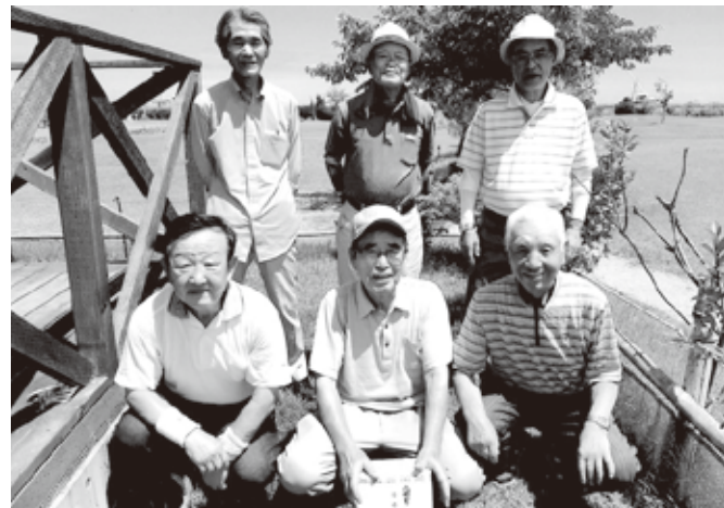
相馬クラブ パークゴルフ大会