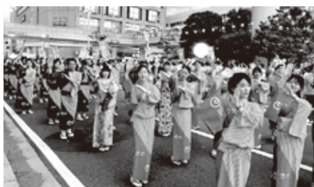
皆さん、踊りも揃っております