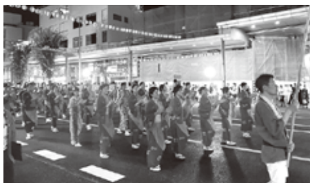
夜になり祭りも最高潮