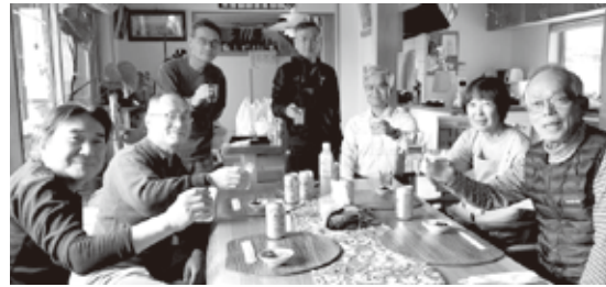
「うどん教室」に参加された方々と懇親会の様子