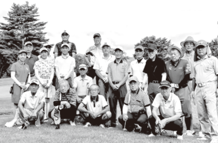
しのぶゴルフ倶楽部 写真

しのぶゴルフ倶楽部の活動は、3月から11月まで月1回実施しています。今年度も異常気象による酷暑にも負けず月1回のゴルフ活動を実施し新規会員も加わり友好を深める事