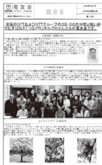
作成した会報誌19号 表面

今までのパソコンのスキルを活かし、会報誌「生きる」19号を作成しました。会の情報や各サークルの活動状況を収集して編集作業に取り組んでいます。年に2回作成し会の情報を発信しています。