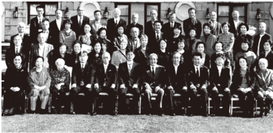
NTT福島グループOB・OG交流会 令和5年10月31日 於 グランドエキシブ那須白河 交流会参加者

平成30年開催後、台風被害対応やコロナウイルス感染防止対策で中止していた「OB・OG交流会」が、4年ぶりに昨年10月31日西郷村グランドエキシブ那須白河において開催