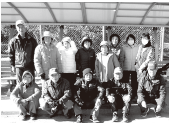
今年は優勝めざします