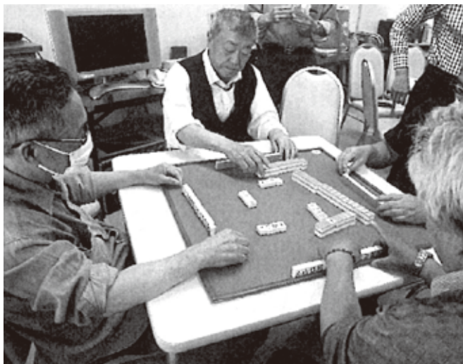
4年振りに再開 牌さばきも健在です

麦を毎月楽しむ事を基本としています。その他、会員のニーズが有り、季節の節目に「忘年会・新年会・納涼会」等を開催し、親睦を深めながら楽しく活動しています。入会希望は常時受け付けております。 そばの会は、会員から紹介された方を賛助会員として、地域の方とも一緒に活動しております。