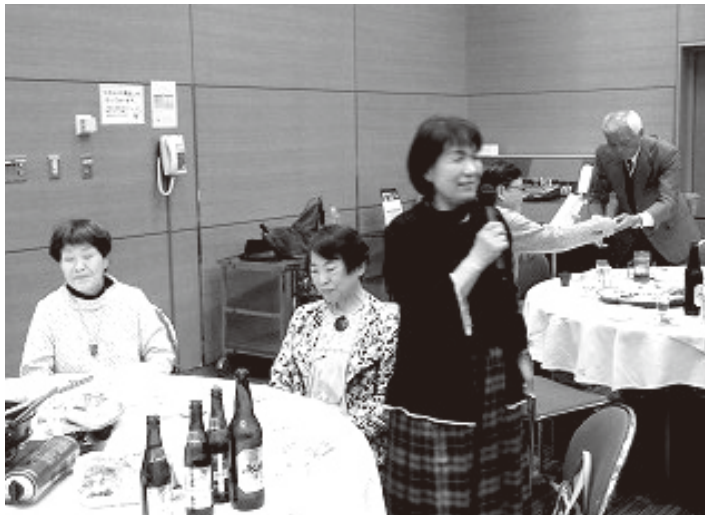
参加者から 近況の紹介

世代では次に会う機会も中々難しいので、内容を抑えて開催する事を決めました。案の定、出席の葉書をいただいた方から、体調不良や身内の不幸等で欠席すると7名の方から連絡が有りました。また、初めて福島地区電友会と電友吾妻会の2団体での合同開催とし、51名の参加となりました。