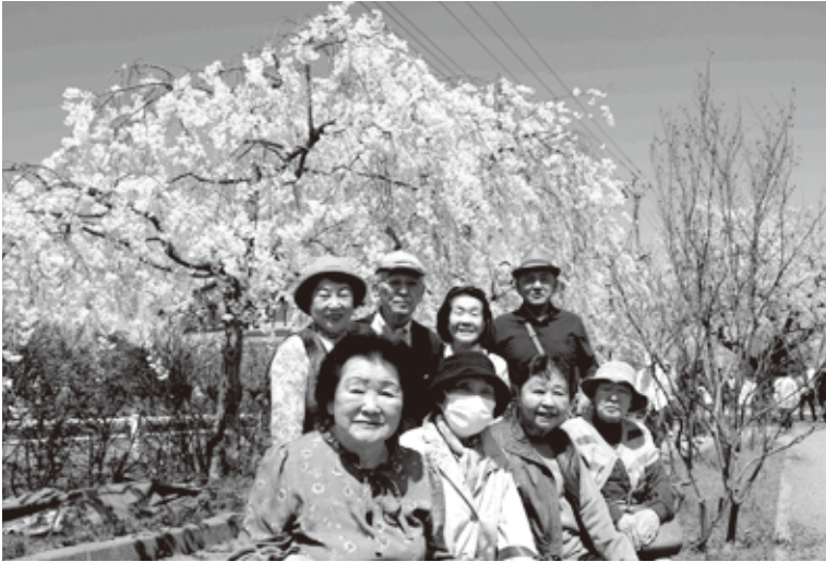
美しい青空と桜を背景に、笑顔も美しいです

9名の方が参加。天気にも恵まれ、しだれ桜はちょうど満開を迎え、とても素晴らしい花見となりました。昼食は熱塩の完全予約制の「善ちゃんそば道場」の天ぷらざる蕎麦を食べて、楽しい一日を過ごすことが出来ました。