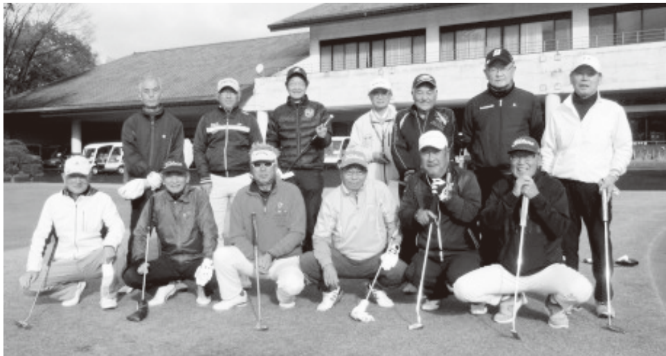
レベルの高い(?) サークルです

電友あさか会発足30周年(平成25年)記念行事の一環として、地球温暖化防止施策の「食用廃油リサイクル運動」を会員等が回収し、精製・販売は社会福祉法人「にんじん舎」(知的障害者施設)がバイオ・ディーゼル燃料(CO2削減)化し、収益は「にんじん舎」が取得。会員は素より・NTTグループ・飲食店等の協力得て令和6年4月末累計で2755