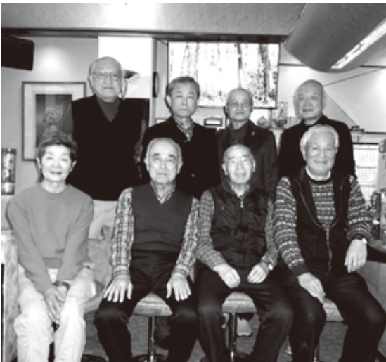
2月例会 参加の皆さん