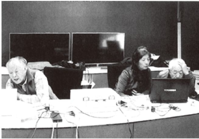
HP作成等の勉強会 先生(右側)も手順が分からなくなり悩んでいます

視覚障害者支援組織「にじの会」に対する支援活動、デジ―図書作成。令和5年度は28冊作成しました。主なものに「思わずクラシックを聴きたくなる雑学書」「水底の女」「愛し続けられない人々」「博物館の少女」等です。また、閲覧回数は過去作成の図書も含めて2246回を数えました。