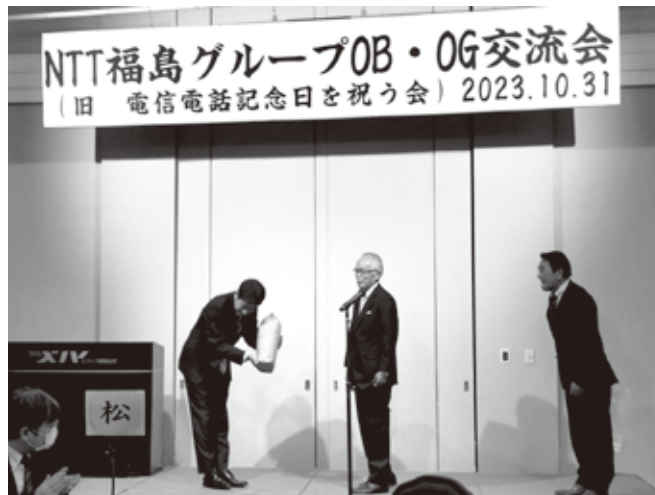
郡山営業支店長への贈呈 (3kg)

会員の皆様には、年明け早々にお配り致しました。友人知人、お隣さんにもお裾分けしていただき大輪の花を咲かせ楽しんでもらえらると思えます。