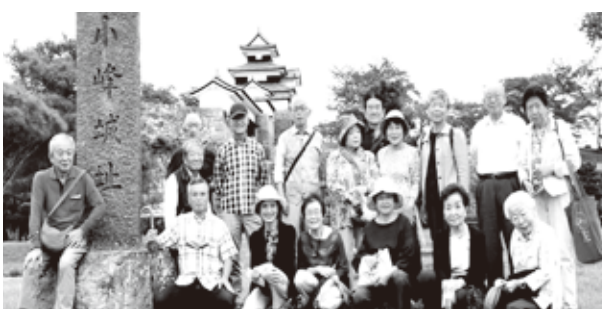
小峰城散策参加者