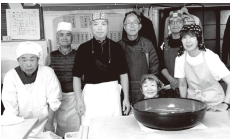
「そば教室」に参加された方々

室」この思いもありました。会食中はそば打ちの反省や今回の課題等の話題、そして会員の近況等々の話で盛り上がりました。参加された皆さんが喜んでお帰りになる姿が主催者の励みとなりました。ここで主催者のチョンボが発生しました。会食の嬉しさのあまり一番大切な会食中の写真を撮り忘れてました。申し訳ありませんでした。