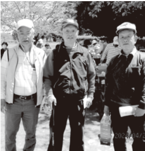
原町との グラウンドゴルフ交流会

令和6年4月25日南相馬とのグラウンドゴル フ交流大会南相馬で開催され、相馬からも3 名参加し交流を深めてきました。