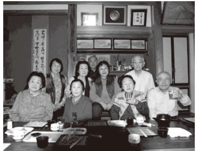
天ぷらざるソバを食べて満足です