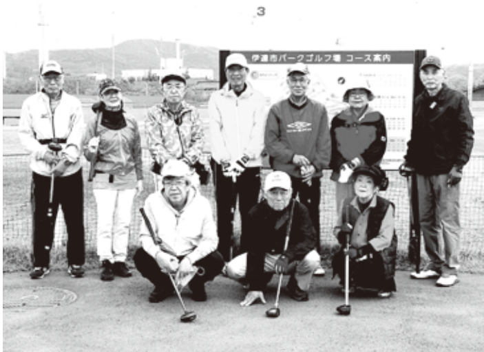
パークゴルフで 会員の交流を図っています

福島地区パークゴルフ倶楽部は会員数15名で、3月頃から11月頃まで活動を行っています。月1回の例会は大会方式で、福島市P.G.場と伊達市P.G.場で交互に開催し、会員相互の交流を図っております。