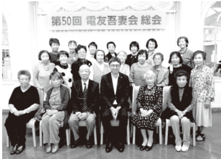
吾妻会 R5 総会