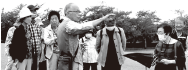
公園内案内の様子