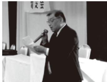
司会の杉事務局長