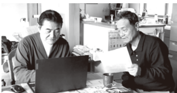
「生きる」会報編集作業

令和6年新年号の「生きる」会報を会員の協力もあり、無事発行できる事が出来ました。昨年のサークル活動が活発であったため編集記事が豊富で大変助かりました。「生きる」会報は会員の皆様楽しんでいただいております。今後もサークルの活発な活動で多数の投稿をお待ちしております。