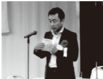
来賓挨拶 紺野部長