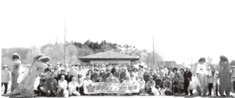
化女沼ダム湖畔 観桜会・環境美化活動 2024.4.13(土)

4月13日の化女沼ダム湖畔・観桜会・環境美化活動には、満開の桜の下で多くのボランティアの仲間が参加し活動しました。4月から11月まで月1回の環境美化活動でのゴミ拾い、環境整備活動として、5月から11月まで、毎週末早朝から2時間程度、桜の下草刈り、消毒、肥料の追肥等の活動を行っております。