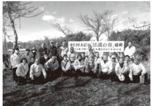
鎮魂の桜植樹記念