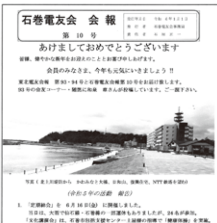
石巻電友会報 第10号表紙

平成27年から年1回発行してきた「石巻電友会報」が今年1月で第10号になりました。