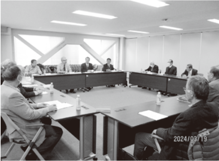
地区会長・事務局長会議

6年3月19日、NTT五橋ビルにおいて開催。6年度事業計画、支部役員会・代表者会のスケジュール、サークル活動・文化講演会助成金申請時の注意点、宮城支部主催行事、定期報告の一部変更、データベースのセキュ