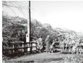
海外からのお客様