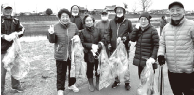
清掃作業開始のメンバー 頑張りましょう!

内外の観光客に気持ちよく鑑賞していただけるよう、大河原町主催の白石川河川敷一斉清掃作業に参加しました。