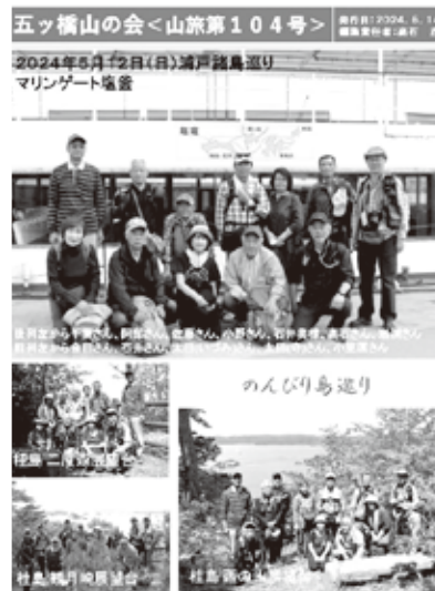
山旅第104号表紙 (浦戸諸島 R6.5)

(4) いきいきITサークル 月2回、「いきいきITサークル」でパソコン教室をリモート開催しています。テーマは①パソコン便利機能の活用、②身近なデジタルサービスの習熟他、IT関係トレンド。日常生活でスマホ等を使うサービスが急速に増えており、使いこなせないと不便なことからメンバーと一緒にチャレンジしています。YouTubeで概要を学習し、操作実習を通じて理解を深めます。