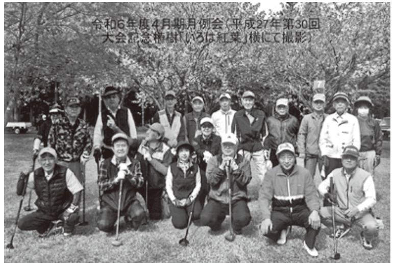
R6.4.26 月例会 (ふれあいの森P.G場)