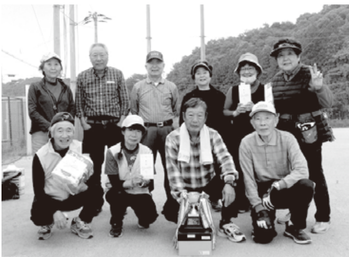
和気あいの仲間達

会員の高齢化が進み、当初は40名ほどいたメンバーが現在は18名となっております。さらに、練習や大会への参加者も減少してきました。そのような中でも頑張って年7回の練習や大会を実施しています。体調不良であろうと、身体がガタガタであろうともプレーが始まると、つい走り出しています。