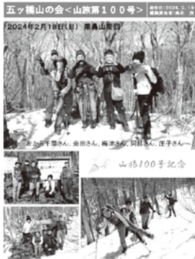
山旅第100号表紙 (黒鼻山 R6.2)

今年度は、4月の「しばた一目千本桜」花ウォークでの足慣らしを皮切りに、二輪草の咲く青麻山で初登山を実施。5月には「山旅百号」達成記念行事の一環として、場所を山から海に移して、松島湾の浦戸諸島島巡りを楽しみ、これからの本格山シーズンの前の息抜きをしました。