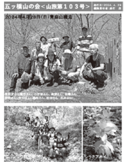
山旅第103号表紙 (青麻山 R6.4)

(5) ウェルネットみやぎ (ボランティアサークル) 1997年に設立した「ウェルネットみやぎ」です。現在20名の会員が在宅作業を中心に活動しています。図書を点訳し、視覚障害者に情報を提供する「サピエ図書館」に点字データ図書として登録しています。また、朝日新聞のコラム「ひと」と「天声人語」を毎日点訳し、1週間分をとりまとめて点字印刷とメールで利用者の皆さまに送付しています。令和4年に厚生労働大臣からボランティア表彰をいただきました。