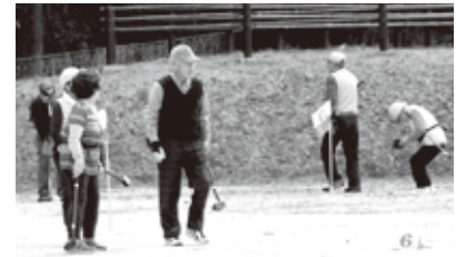
プレーが始まると夢中になります

思い起こせば、先輩諸氏が平成10年1月17日・大河原町中島集会所で産声をあげ25年の歴史を刻んできました。しかし、時の流れに逆らうことはできず前記のとおり、高齢化で大河原町在住者を中心とする会員も徐々に少なくなり、仙台・岩沼・白石などの遠隔地のみなさまに頼ることとなり、運転免許証更新も「認知症」検査対象者が多くなりました。よって、未然の事故防止等を考慮し決断したところ です。