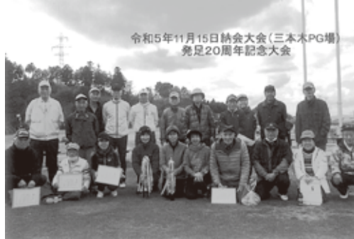
R5.11.15 納会 & 20周年記念大会