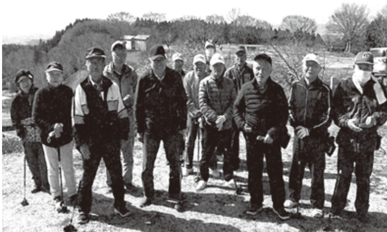
桜の花の開花と共に 気持ち良くプレイしました