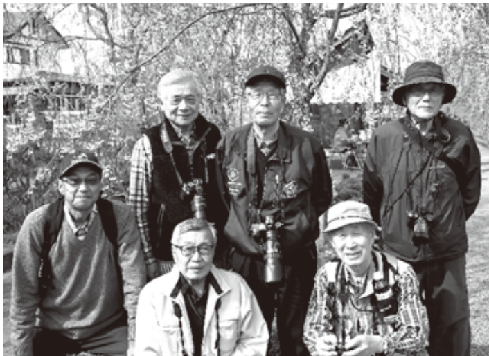
第1回撮影会 (喜多方市 日中線しだれ桜R6.4)

初日は、仙台から参加者6名が会員2台の車に分乗して喜多方に向かい、喜多方ラーメンでエネルギーを補給した後、日中線の、しだれ桜を撮影して廻りました。お天気はまずまずで、桜の開花は三〜四分咲きといったところでしょうか。次に農家蔵の並ぶ杉山集落を巡って、夜は日中温泉に浸り翌日に備えました。