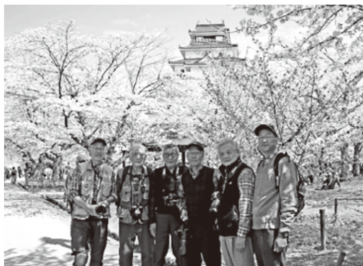
第1回撮影会 (会津若松市 鶴ヶ城公園R6.4)

会津若松の鶴ヶ城公園の桜はちょうど満開で、観光客も多く、桜の花も人もいっぱいの中、撮影ポイントを見つけてはシャッターを押しながら園内を周回しました。2時間ほど撮影した後、まだまだ撮り尽せない未練を残