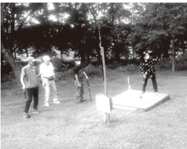
合同レクでパークゴルフをするグループ

令和5年9月8日、天候は曇りながらレク日和、参加会員は50名、会場は恒例となっている岩手県洋野町大野にある「おおのキャンパス」です。午前中は、牧場に隣接の広々としたパークゴルフ場で日頃の運動不足の解消を兼ねてのプレイ、趣味の木工作品づくり、入浴施設でのんびりとリラックスタイムを過ごす皆さん等、あっとい間の2時間でした。お楽しみはメインイベントの昼食会、食事には少々のアルコールも出され、話が弾み更にカラオケが加わり帰路の時間ぎりぎりまで賑やかな親睦の一時を過ごしました。