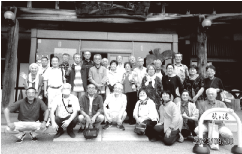
5年ぶりの合同レク 酸ヶ湯温泉にて

5年ぶりに恒例のレク実施に向け、7月30日OBサロンにおいて退職者の会と打ち合わせを行いました。平成30年度好評だった「酸ヶ