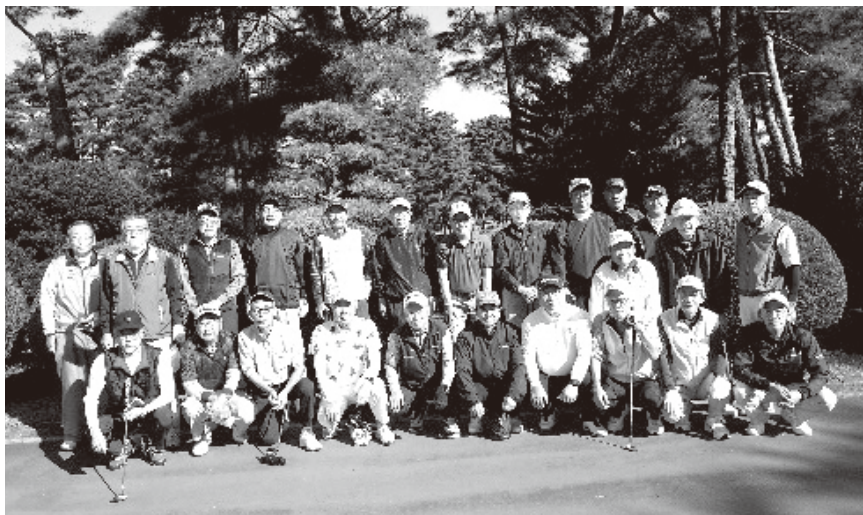
ゴルフ好きの集り ハツラツとしたおっさんたちです