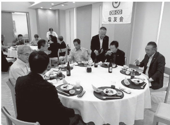
懇親会(右側 千葉会長 何から食べようかな～)

ことにしました。色々なご提案を頂きましたので活動の参考に致します。有難うございました。 総会に引き続き、懇親会へと移りました。お昼時もあり、料理をいただきながらアルコールも進み、4年ぶりのお互いの近況など話題で盛り上がりました。 今回の懇親会は、再会することで近況交換をすることを主に設定しましたが、アクセントとしてレセプションなど取り入れても良かったのでは等の、ご提案がありました。次回工夫をしたいと思えます。