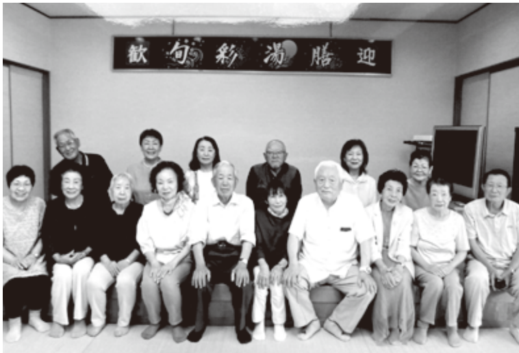
懇親会での名言もありました。 これからもおおいにお話ししましょう！

ねてまいりました。総会では予定していた議案は原案どおり承認され、今年度の活動を進めて行くこととなりました。 堅い話はこのままで、お楽しみのお食事・懇親会へと突入し和気あいあいとおしゃべり・カラオケ等により大盛り上がりへ。その中でもとても気に入った話は「歩かなければ歩けなくなる。話さなければ話せなくなる。食べなければ食べられなくなる。」との含蓄ある話などもありました。皆さん温泉に入るなど時間一杯まで楽しんで帰途となりました。