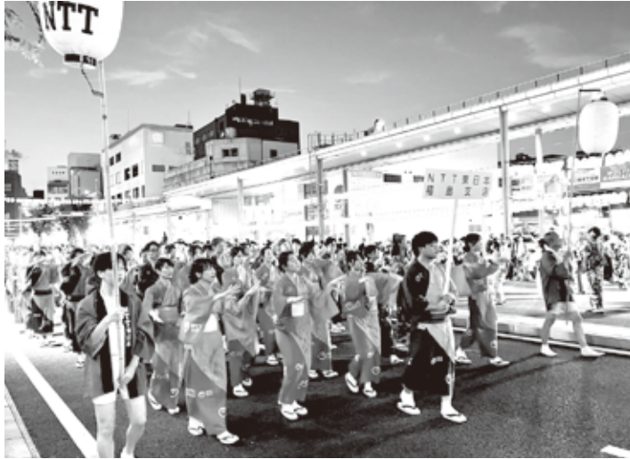
着付けで祭りを 応援しました

燃料(CO2削減)化し、収益は「にんじん舎」が取得。会員・NTTグループ・飲食店等の協力を得てR5年9月末累計で2535ℓ提供しました。今後も継続実施いたします。 ◎うねめ踊り着付け手伝い 毎年、郡山の夏祭り「うねめ踊り」が開催されますが、令和5年の参加数は60団体で3400名の踊り手でした。 NTT福島支店も参加のため、電友あさか会の女性も例年どおり着付け手伝いに協力。8月3〜4日、4名で着付け手伝いをし、踊り手達を応援しました。