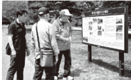
ツーリズムガイド風景

でいて、私たちを過去の時代に連れ戻してくれるような気持ちにさせてくれました。小峰城の壮大な建築とその背後にある歴史は、私たちにあって忘れられない体験となりました。