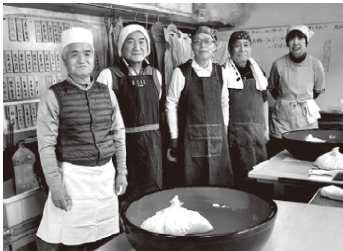
うどん打ち教室に参加されたメンバー

◆ 会津電友会 ◎ 定期総会開催 7月21日、4年ぶりに集合による定期総会を会津迎賓館において開催しました。3年間何も出来ず、ようやく活動ができるようになったことを皆で喜び合いました。