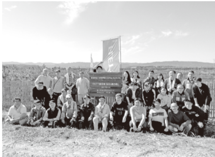
下草刈りでいい汗を流しました