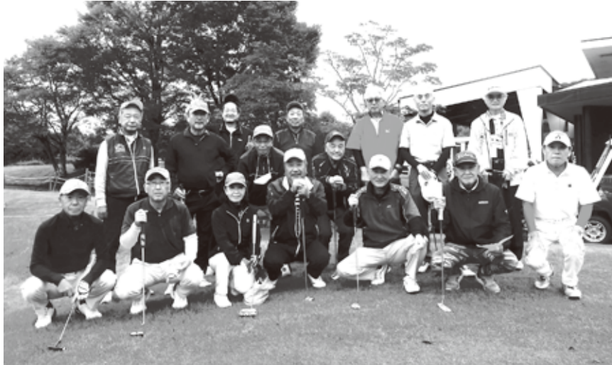
様々なゴルフ場でプレーしています (令和5年10月10日 宇津峰カントリー倶楽部)

燃料(CO2削減)化し、収益は「にんじん舎」が取得。会員・NTTグループ・飲食店等の協力を得てR5年9月末累計で2535ℓ提供しました。今後も継続実施いたします。 ◎うねめ踊り着付け手伝い 毎年、郡山の夏祭り「うねめ踊り」が開催されますが、令和5年の参加数は60団体で3400名の踊り手でした。 NTT福島支店も参加のため、電友あさか会の女性も例年どおり着付け手伝いに協力。8月3〜4日、4名で着付け手伝いをし、踊り手達を応援しました。