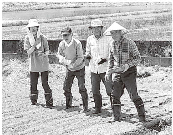
5月17日の種蒔き風景