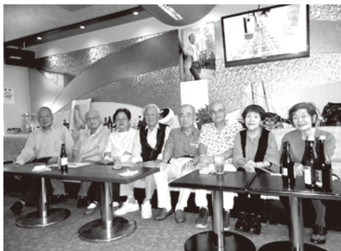
8月例会参加者 例会を楽しみに歌の大好きな皆さん

その結果については次号でお知らせ致します。なお、常時入会希望者を募集しています。興味のある方、連絡お待ちしております。