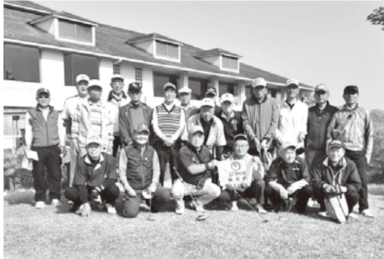
元気にゴルフを楽しむ仲間達です