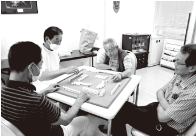
やっと活動再開です