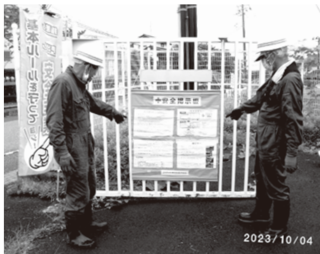
無人交換所除草作業前安全確認 (舞木交換所)

今回より、上下刃逆回転ハサミ式刈払機の使用が追加され、作業事故発生の確立が少なくなりました。