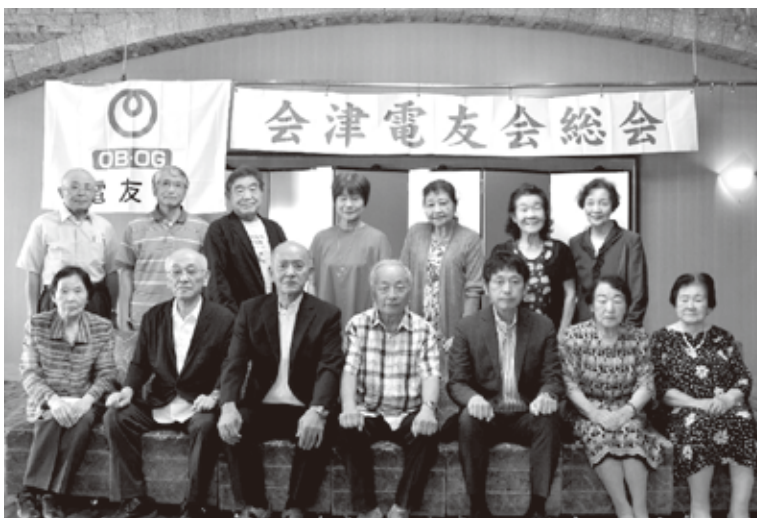
再会を喜び合いながらの記念撮影

届きました。このような会員の方のご意見は主催者として次回以降開催する上で励みとなりました。