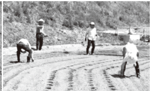
5月17日ひまわりの種蒔き

今年度の活動は、5月17日会員の畑を借用して、ひまわりの種蒔きを実施しました。南湖公園付近で国道294号白河バイパス(新道)沿いに広大な畑を用意していただきました。会員5名の参加で横一列に並んで種を2、3個指でつまみ埋めて行く作業を一往復しました。当日は蒸し暑く熱中症に注意しながらの作業となりましたが、無事終えることが出来ました。当面の工程である間引きと雑草取りをしながら秋の収穫まで見守りました。