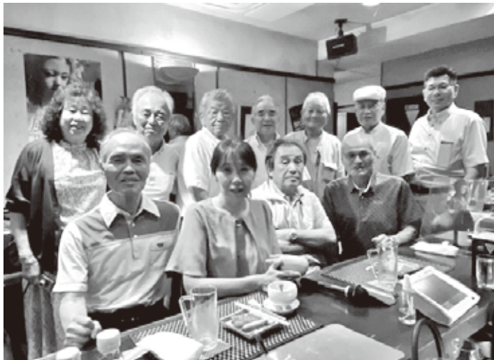
令和5年7月納涼会 そば好きが集まる楽しい会です

入会希望は常時受け付けております。そばの会は、電友会会員以外の方でも会員から紹介された方を賛助会員として、会費は免除して、地域の方とも一緒に活動しております。