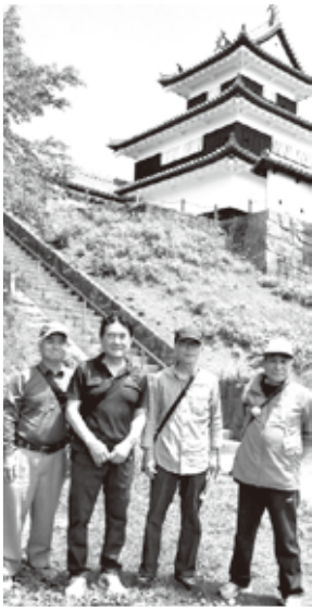
参加メンバー(小峰城公園内)

小峰城と隠れキリシタンの歴史を通じて私たちは自らのルーツと結びつき、これからも多くの教訓を学ぶことができるでしょう。