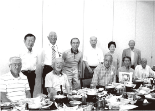
4年ぶり 対面での定期総会

第30回定例総会は、新型コロナウイルス感染症の影響がやや落ち着いたことから4年ぶりの対面会議で行いました。令和4年度経過報告、会計報告及び会計監査報告、令和5年度事業計画(案)及び予算(案)について議案を審議し、承認されました。