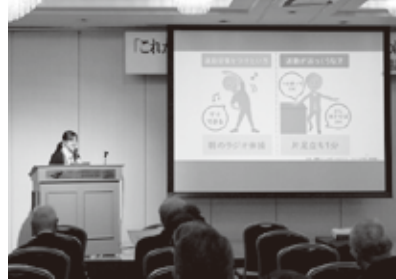
講師(福島市保健所の保険師)

等を確認し、同日実施する文化講演会の演題等の意見を出し合いました。会議終了後は、3年ぶりの懇親会を少人数で行いました。 ◎文化講演会を開催 令和5年10月25日の午前に、NTT福島グループOB・OG交流会の第1部として、文化講演会を開催しました。4年ぶりの開催となりましたが、75名の方に参加いただきホッとしました。 演題は、電友会本