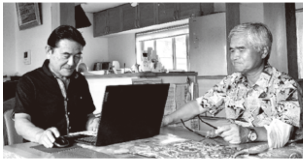
「生きる」会報の作成状況

今年度からP C同好会は「生きる」会報発行に特化したサークルとなりました。今まで勉強してきたP Cの操作や関連ソフトの知識を会報の編集作業に生かしていきま