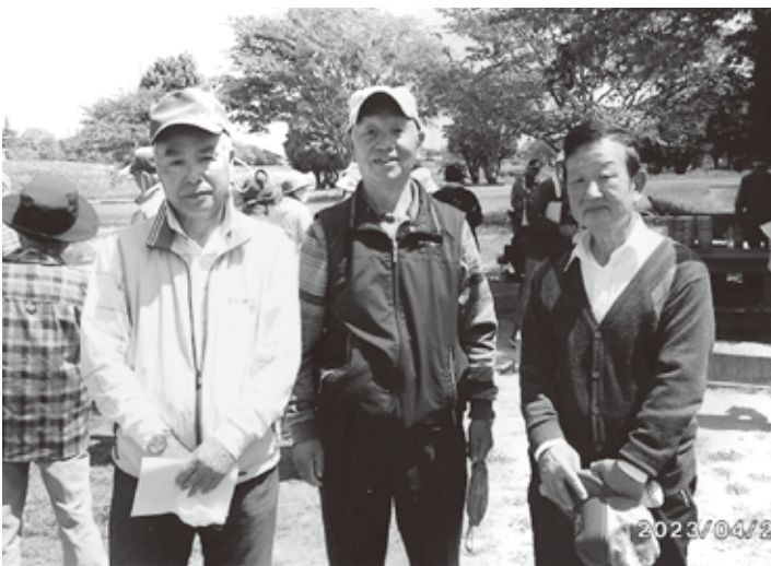
南相馬との交流PG大会 3名参加

令和5年4月25日南相馬市水無川河川敷で開催。相馬からは3名の参加で交流を深めました。