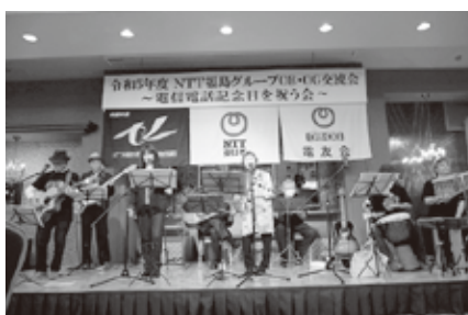
バンド「ふれんず」演奏