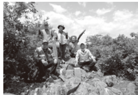
6月蒲生岳山開き 828m(会津のマッターホルン)

の只見川を眺め最高の気分。登れたことに大満足でした。鎖を頼りに慎重に何とか下山しましたが、高齢者は少しハードルの高い、手強い山でした。