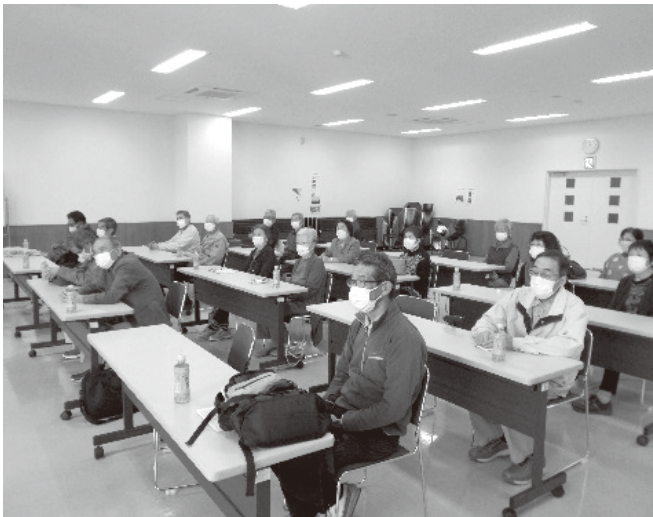
重要な話をしっかりと聞いて勉強しています

ウイルスも5類に移行したものの、流行が懸念されるインフルエンザにも配慮し、手指の消毒・マスク着用等、健康に気を配りながらの開催でしたが、26名の会員が参加し、終盤の質問・回答では、家庭内における各部屋の火災報知器について、経年劣化していないかしっかりと確認しておくようにと指導を受けました。最後は講師に対して盛大な拍手が送られ、参加された皆様も互いの健康と安全を祈念しあい、盛会裏に終了する事ができました。参加いただきました皆様には大変感謝しております。