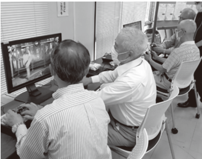
バーチャファイター 対戦中

参加した皆さんからは、昨年も参加して楽しかったので今回もエントリーした。頭を使うことは予想していましたが、思った以上に体を使うことに驚いた。ドライブゲームのタイムが更新できると嬉しい。頭と体力を使うので刺激になった。などの感想や意見が寄せられました。