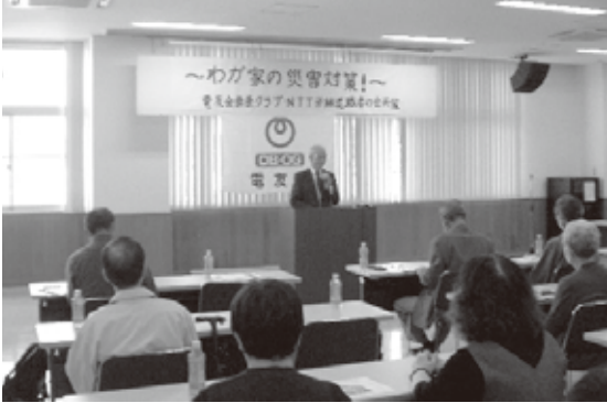
災害から身を守る備えとは…

ウイルスも5類に移行したものの、流行が懸念されるインフルエンザにも配慮し、手指の消毒・マスク着用等、健康に気を配りながらの開催でしたが、26名の会員が参加し、終盤の質問・回答では、家庭内における各部屋の火災報知器について、経年劣化していないかしっかりと確認しておくようにと指導を受けました。最後は講師に対して盛大な拍手が送られ、参加された皆様も互いの健康と安全を祈念しあい、盛会裏に終了する事ができました。参加いただきました皆様には大変感謝しております。