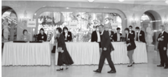
仙台会場受付模様 約400名の皆さんが出席