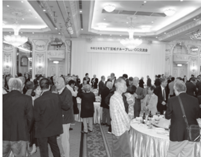
懐かしい人達との会話が弾みます

に懐かしい仲間との再会や現役の方々を交えた賑やかな懇親会となり、楽しく交流を深めました。