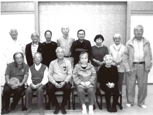
秋の研修旅行の 参加者

州柳津虚空蔵尊を参拝し、11時に「南三陸ホテル観洋」に到着。眼下に雄大な太平洋を眺めながらの入浴、三陸産海の幸の昼食に舌鼓を打ち、4年振りに参加者の美声と様々な会話を花を咲かせました。退館後、南三陸さん商店街に着きましたが、以前の賑やかな南三陸の街は姿を消し、海の見晴らしを遮る防潮堤、かさ上げされて以前の街の姿は無く住宅は3か所の高台に移築されていました。旧南三陸防災庁舎は遥か眼下。防災記念館は今昔の写真等が展示され、災害の恐怖が展示されていました。以前の商店街にはさんさん商店街が残るのみです。それぞれお土産の買