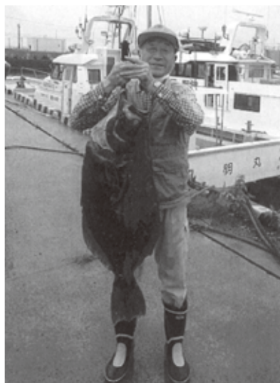
本人もビックリ!!!もしかして地球を釣ったんじゃないか?と。