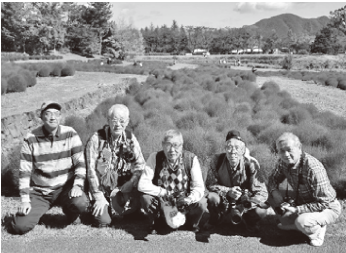
真赤に色付いた コキアの前にて

今年度2回目の撮影会を、10月18日に川崎町の「国営みちのく杜の湖畔公園」にて実施