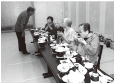
美味しい海の幸に舌鼓

13名の参加で古川支店9時30分出発。途中「日本三所の秘仏」と言われる弘法大師由来の南三陸奥