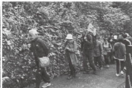
大深沢橋のずーっと下の遊歩道を歩きました