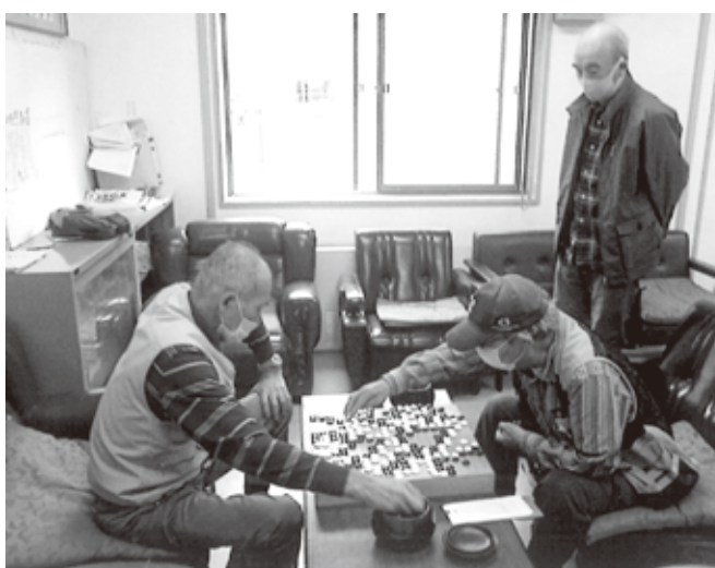
囲碁クラブ 対局風景

令和5年度も毎週木曜日に退職者サロンで「入室時の消毒、マスクの着用、窓の開放」を実施し囲碁の対局で会員の親睦を図っています。会員の高齢化が進み対局がたびたび中止になることもあります。囲碁に少しでも興