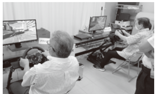
ドライブゲーム 意外に力が入ります