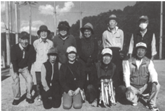
10月12日定例会に参加の皆さん