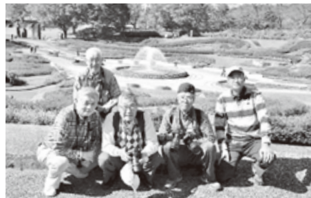
第2回撮影会 (国営みちのく杜の湖畔公園 R5.10)

しました。快晴で撮影には絶好の秋空の下、参加会員5名で赤く色づいたコキア畑をメインに園内を巡り、各々が自分の思う撮影ポイントを撮って廻りました。 また、夏の猛暑にもめげず、月例会は継続して毎月開催しており、月ごとに、各会員が仙台青葉まつり（5月）、夏まつり