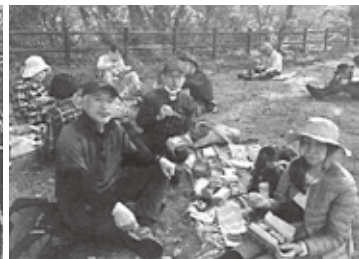
渋滞で遅れたのでお腹ペコペコ歩く前におにぎり弁当で腹ごしらえ