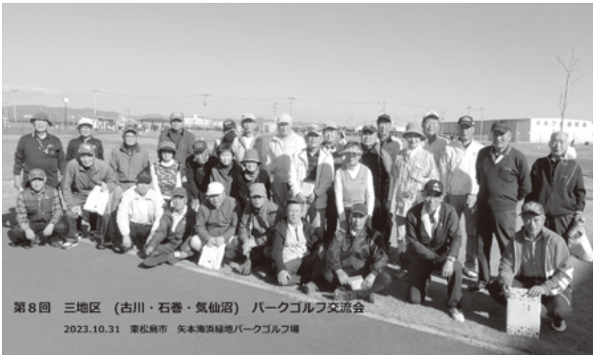
第8回 三地区(古川・石巻・気仙沼)パークゴルフ交流会 2023.10.31 東松島市 矢本海浜緑地パークゴルフ場

10月31日、東松島市の矢本海浜緑地公園パークゴルフ場において、大崎、気仙沼、石巻の三地区合同のパークゴルフ交流大会を開催しました。大崎12名、気仙沼7名、石巻11名の総勢30名が参加。結果は3名が1002点