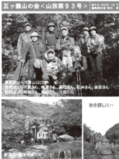
山旅第 93 号表紙 (東栗駒山 R5.10)