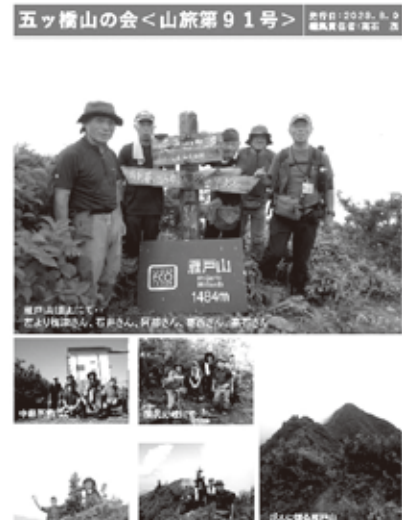
山旅第 91 号表紙 (雁戸山 R5.8)