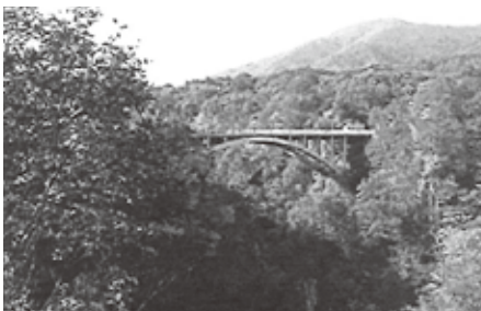
紅葉の美しさで有名な鳴子峡大深沢橋

五ツ橋クラブ「山の会」との共催で、「おくのほそ道健康ウォーキング」を行いました。3地区から18名が参加し、宮城県から山形県に至る旧街道「出羽仙台中山街道」を堺田〜中山平温泉までの約5kmの区間(このルートは、その昔、源義経主従が兄頼朝に追われて平泉に下る途中に通った道と伝えられ、江戸時代には松尾芭蕉がその足跡を辿り「おくのほそ道紀行」に記しています)をウォーキングの予定で出発しました。道路の渋滞を予想はしていましたが、休日の好天気、紅葉の見頃とあって堺田へ行く途中の鳴子までもたどり着けないような大渋滞に巻き込ま