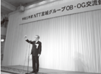
五ッ橋クラブ苦米地副会長の乾杯