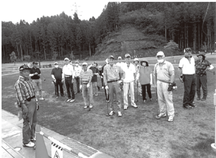
パークゴルフ 月例会参加者

い物をし、帰路では津山町の日本三不動尊に数えられる「横山不動尊」を参拝し、帰路の安全を祈願し、午後4時半に無事古川に到着。次回皆さんと元気な顔で再会する事を約束し散会しました。