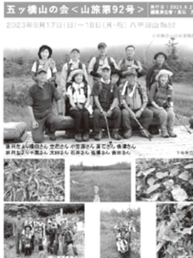
山旅第 92 号表紙 (八甲田山 R5.9)