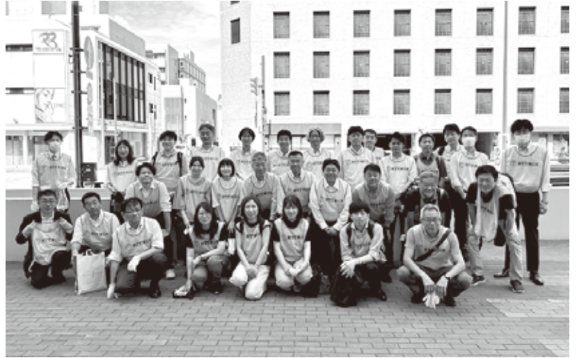
秋田支店の清掃活動に参加

イドを交えながら医学的なお話を楽しく面白く、また、間合いに漫談を交えながら4年前を思い出すような笑いの渦に引き込まれ、最後に参加者からの質問も楽しくお答え頂きながら余韻を残し、無事に講演会を終了しました。