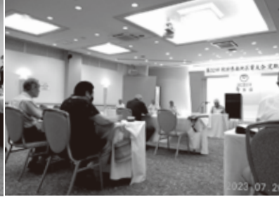
秋田支部の総会で了承された県域一元化について協議