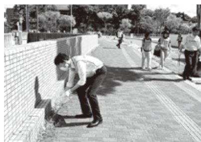
秋田竿灯まつり前の大通り周辺清掃中