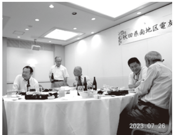
秋田支部一元化が承認され今後の活動に 希望を抱きながら、和やかなひと時

〈東北地方本部より〉 秋田県域一元化について 新秋田支部の新たな船出をお祝い申し 上げます。これからも会員の絆を大切に し、活動が活性化していくことをお祈り いたします。