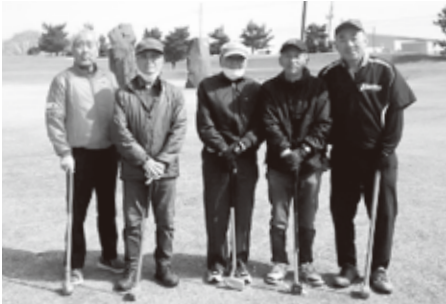
第1回 天王グランパスGGにて

雨で2週間延期した第1回大会は4月21日、晴天に恵まれた天王くらかけGGで開催。今期初めてのグラウンドゴルフと言