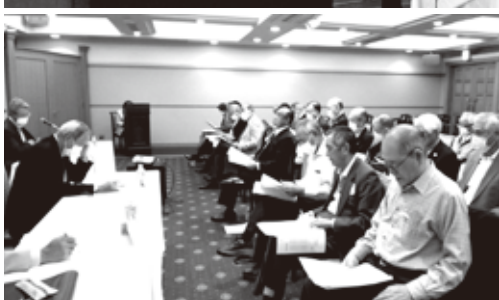
R5.10 支部臨時総会(県域一元化について)