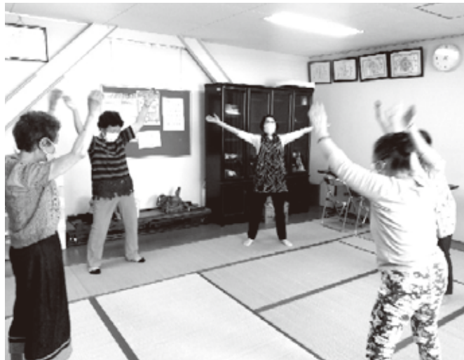
いつでも慰問ができるように準備しています (練習前準備運動)

サロンで各種踊りの練習をしておりますので興味のある方の連絡をお待ちしております。