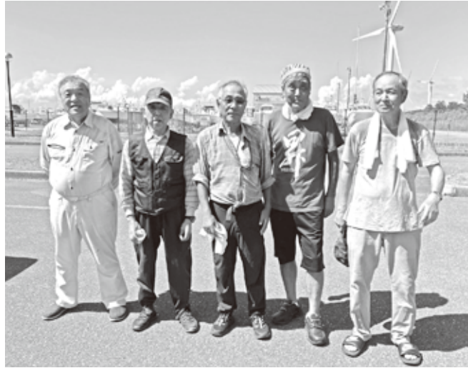
この中の2人は泣きながら 駐車場の砂を集めた…とか?

めて袋に入れて帰りました。(甲子園?) 潮の流れが速すぎて、60cmオーバーは次回 の宿題となりましたが、「晴天の中で真っ青 な大海原を走り抜け、風を感じ、竿を振り、 魚信を待つ!」全員爽快になって笑顔のまま 帰路につきました!