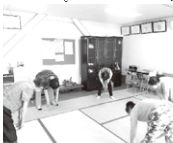
イッチニー、サンシ!

コロナ禍で4年間活動ができないうまま、新年度になりましたが、まだまだ施設からの連絡がなく、一同早く慰問ができないかと気をもんでいます。練習も毎月第4月曜日にNTT・OB