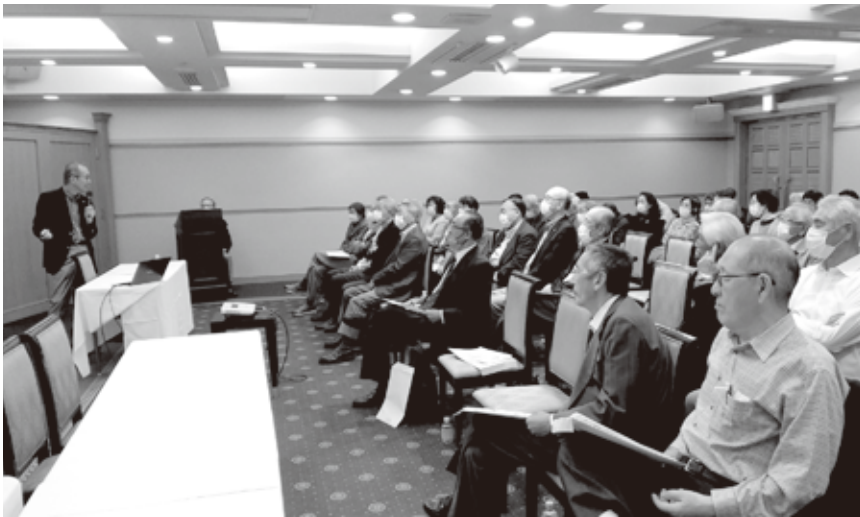
漫談を交えた楽しい講演でした R5.10 文化活動講演会

イドを交えながら医学的なお話を楽しく面白く、また、間合いに漫談を交えながら4年前を思い出すような笑いの渦に引き込まれ、最後に参加者からの質問も楽しくお答え頂きながら余韻を残し、無事に講演会を終了しました。