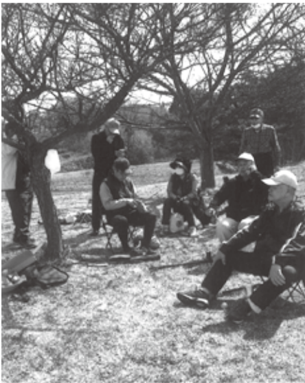
プレーの合間ちょっとひと息

昨年度は、週2回の練習に延べ513名、4回のサークル大会には延べ59名の参加があり練習、大会とも多数の会員の参加により、楽しい活動を展開することが出来ました。