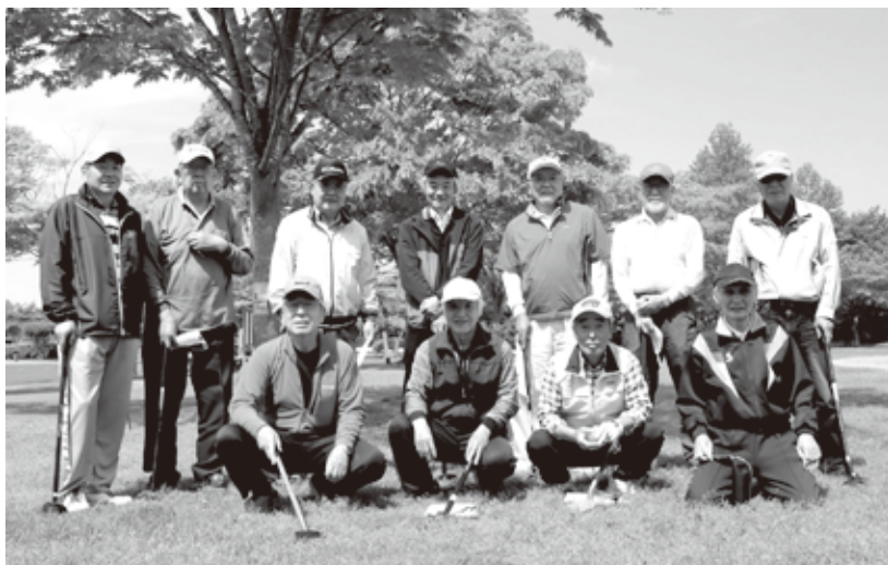
今年も楽しみましょう! (5/18 例会)

会員の健康維持と親睦を図るため毎週水曜日の例会を計画していますが、令和3年度は会場の確保や天候の状況等により20回の開催となりました。