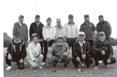
元気にプレーしますよ〜。(5/11 例会)