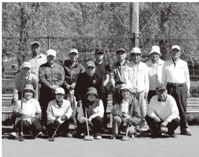
明るく、楽しく、元氣よく、がモットーです

10月27日納会を行い、今年度の反省、来年度への意気込みなど話が盛り上がり、来年も元氣に再会できることを誓い合い散会しました。