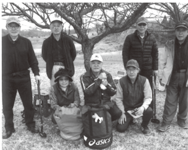
楽しい活動を 展開しています

グラウンド」土曜日は「樺山歴史広場」で練習を行い、その成果をサークル大会で発揮しようと会員一同張り切っています。 次号には大会の結果を報告したいと思います。