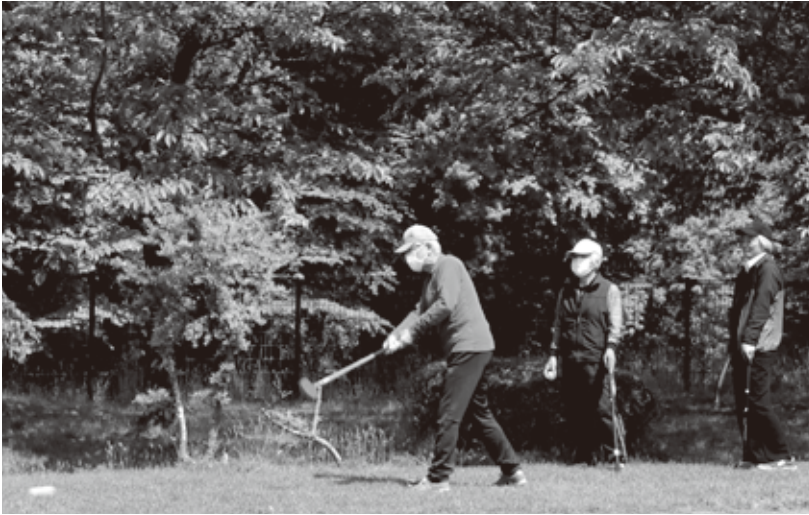
はつらつプレー！！ (5/18例会)

と11月の納会(15名参加)には賞品を準備して参加者を勧誘し体力向上と会員相互の親睦を深めています。 例年ですと4月に総会と懇親会を行います。スタートですが、コロナの収束が見えないことから3年続けて総会なしのスタートとなりました。2名の新会員が加わりましたので今年も4月から11月まで明るく楽しく元気よくはつらつとしたプレーをしていきたいと思っています。