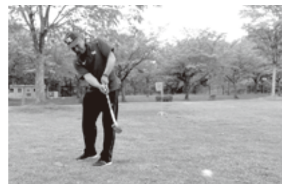
ナイスショット! (5/11 例会)

会員の高齢化により例会の参加者が減少してきておりますが、7月の大会(14名参加)