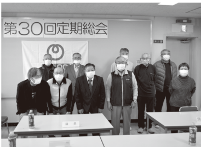
各地区理事による総会 (役員会)

令和3年12月10日NTT県南支店で役員会を開催。前年と同じく、新型コロナウイルス感染拡大により、全員参加の総会とはならず