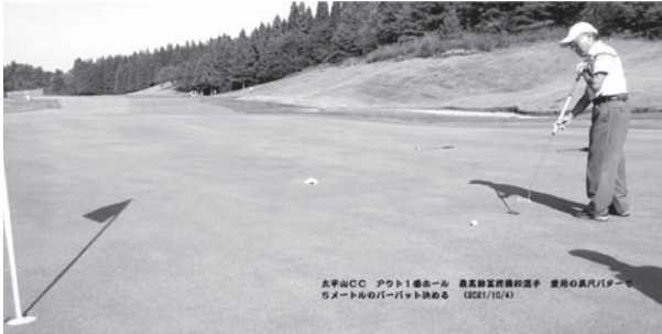
最高齢富樫選手 愛用の長尺パターで5mのパーパット決める